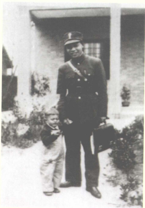
初到江西的蒋经国与儿子孝文合影