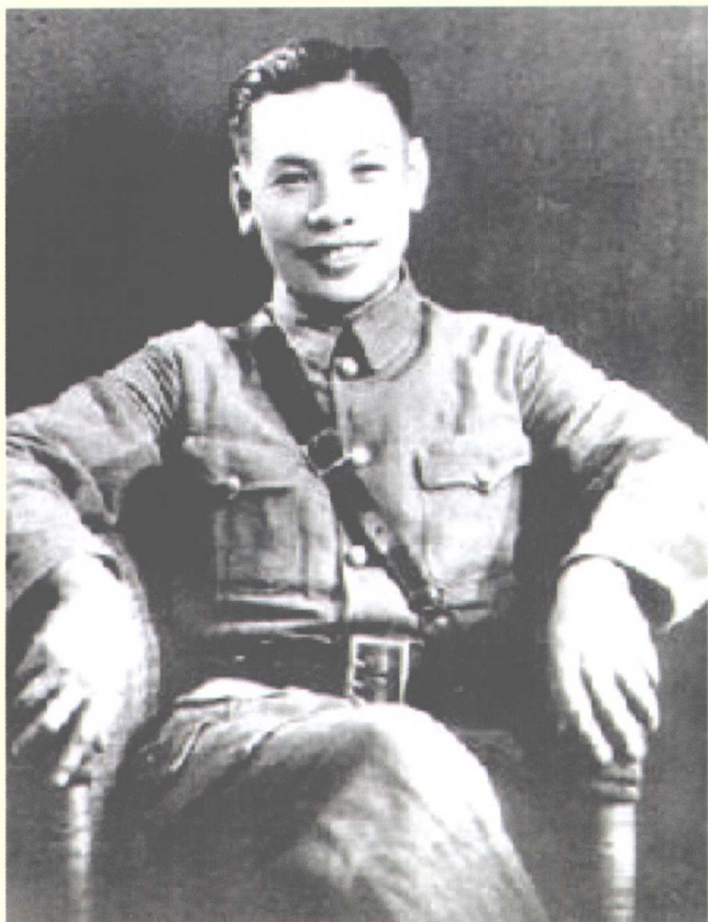
在赣南推行新政的蒋经国