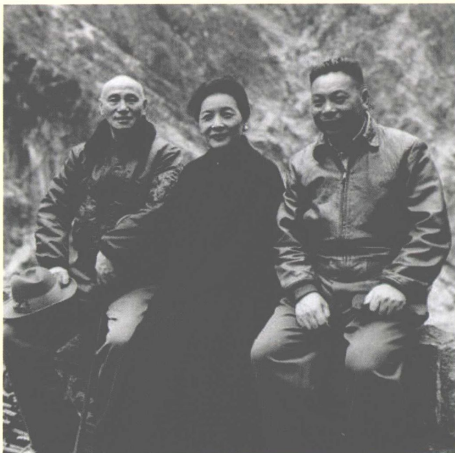
在台湾的蒋介石夫妇与蒋经国合影