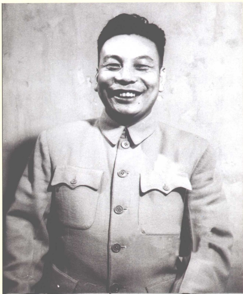
在上海“打虎”的蒋经国