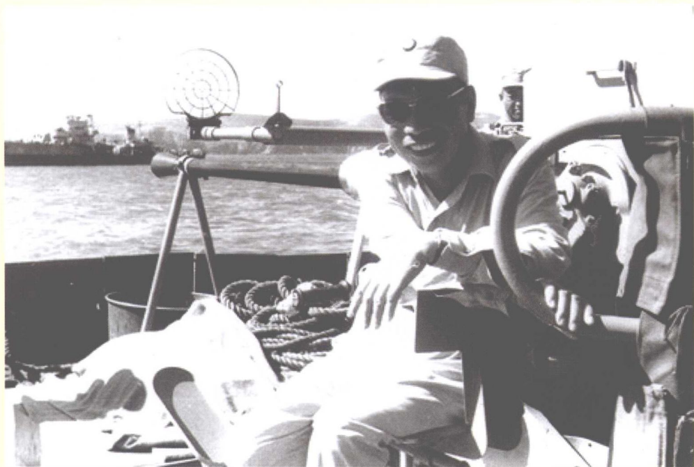
蒋经国巡视大陈岛在太湖舰上留影