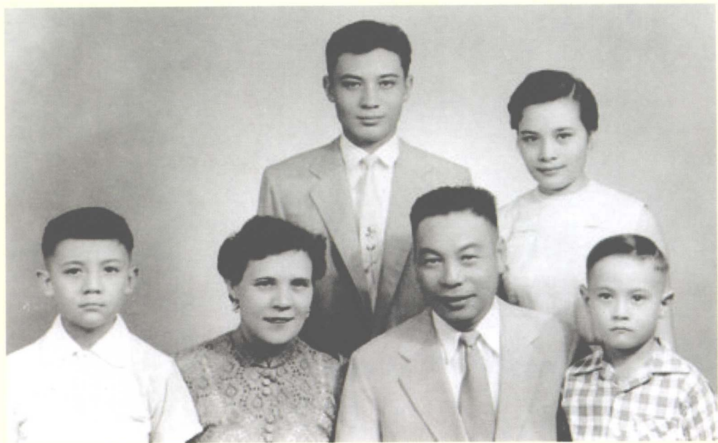
蒋经国全家福（后中长子孝文， 后右长女孝章，前左次子孝武， 前右孝勇）