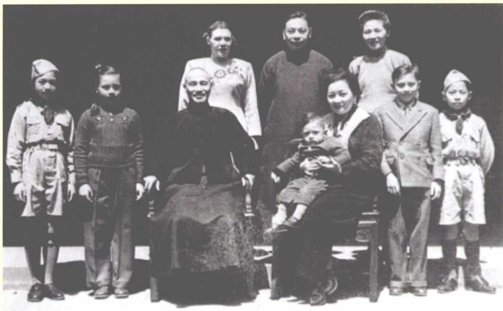
蒋介石和夫人宋美龄与蒋经国全家在浙江奉化溪口合影