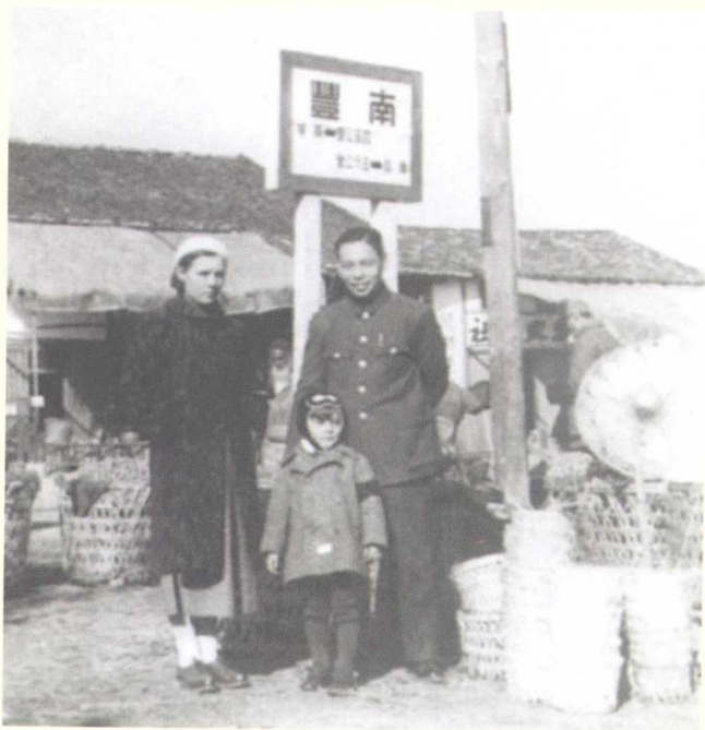
蒋经国夫妇与儿子孝文在江西