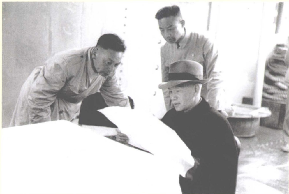
蒋经国陪同蒋介石在军舰上“巡视”