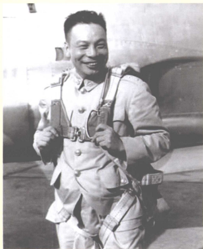
穿着伞兵装备的蒋经国