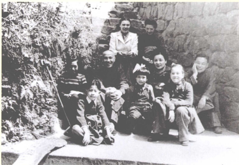
在故乡溪口“隐退”的蒋介石，与儿孙们踏青，开怀一笑。蒋经国难得不是站在父亲身后，他轻松的坐下，感受家庭和乐的美妙