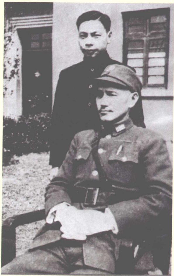
刚回国后的蒋经国与父亲蒋介石在重庆的合影