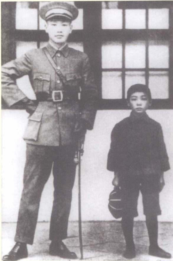
少年蒋经国与父亲蒋介石