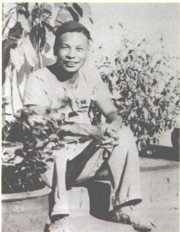
穿着草鞋的蒋经国， 深入赣南乡下，进行 调查