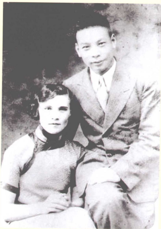
回家补办中式婚礼的蒋经国与妻子蒋方良