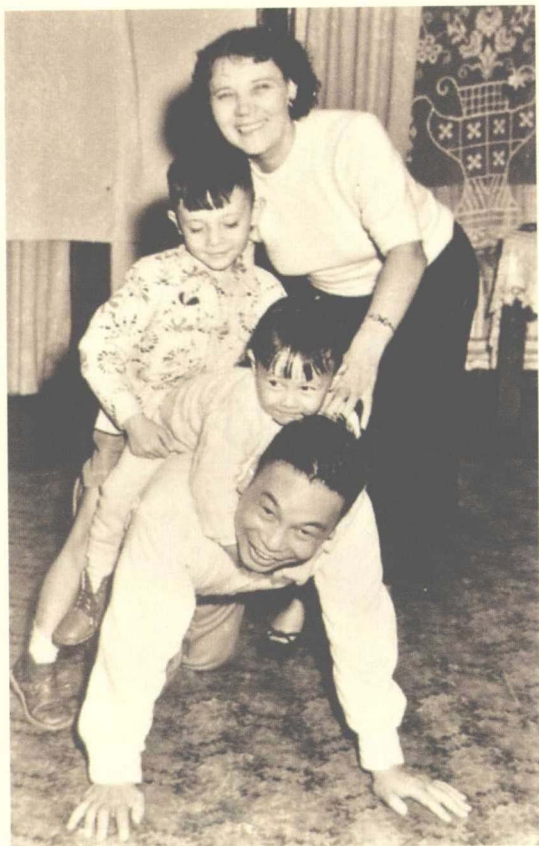
与孩子们一同嬉戏的蒋经国