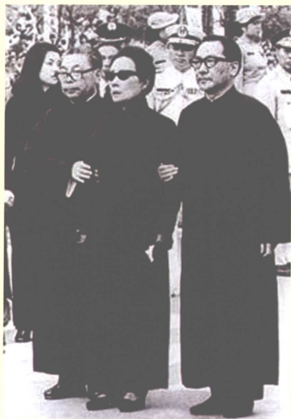
蒋经国与宋美龄在蒋介石的葬礼上