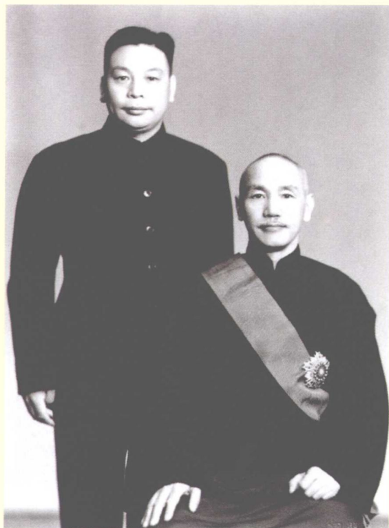
中年的蒋经国与老年蒋介石合影