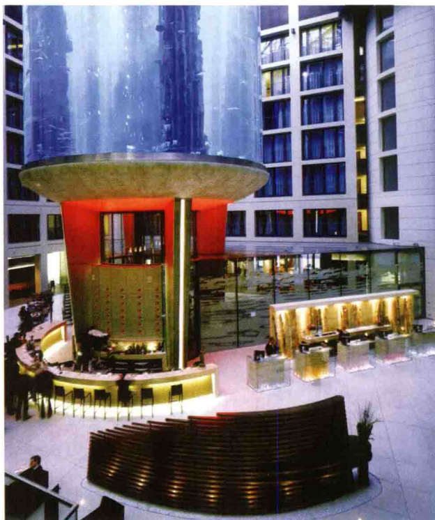
图1-1 某宾馆的中庭空间

公共空间中的“公共”二字，在我们的日常汉语中，应该包含两重意思，一是“公众的、公共的”，也就是“大家的”、“共有的”；二是“公开的”，也就是“当众的”、“发表的”。“公共”在一定意义上包含了一种平等、参与、互动、共享、共有、共同等内涵（图1-1、1-2）。