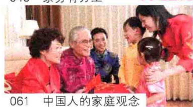
061 中国人的家庭观念