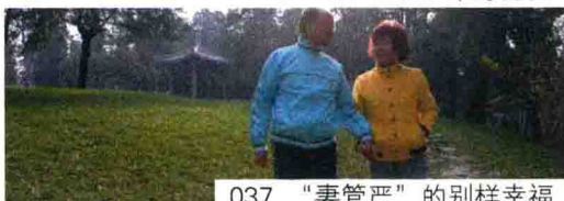
037 “妻管严”的别样幸福