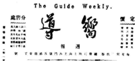
陈独秀题写的《向导》刊名