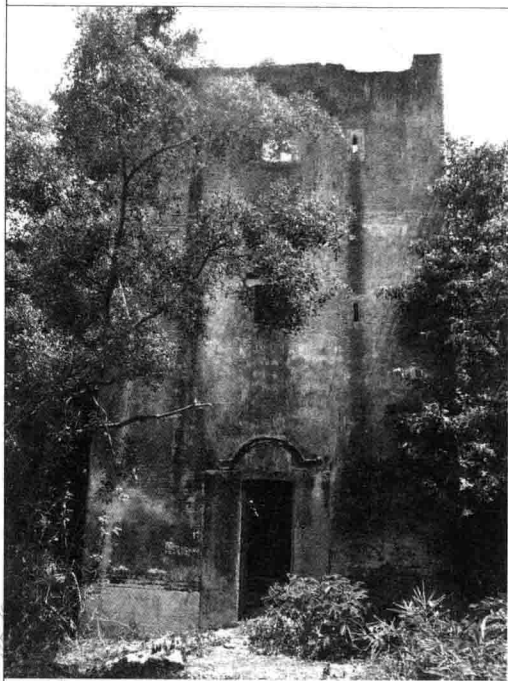
周文雍幼时读书的地方

朝廷，一面引军由潮阳至老家江西，打算另辟战场阻击元军。他刚到海丰北面的五坡岭，就被已经投敌的当地叛将陈懿俘获，献给张弘范。