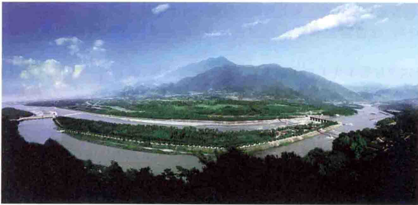
图 1-3 都江堰水利工程

高塔工程方面:公元 11 世纪建成的山西应县木塔(图 1-4),塔高 67.3 m,共九层,横截面呈八角形,底层直径达 30.27 m。该塔经历了多次大地震,历时近千年仍完好耸立,是以证明我国古代木结构的高超技术。