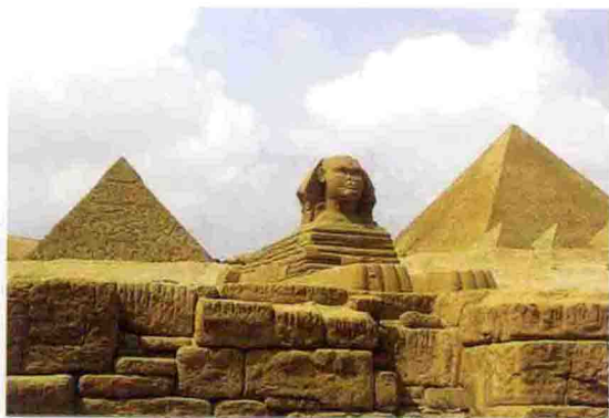
图 1-6 埃及的金字塔和狮身人面像