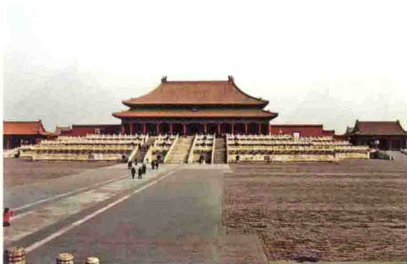
图 1-1 北京故宫