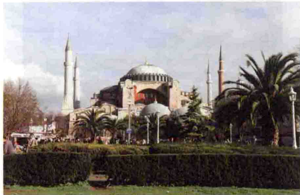
图 1-2 索菲亚大教堂

桥梁工程方面:公元 6 世纪我国隋朝建成的赵州桥,为单孔圆弧弓形石拱桥,全长 50.82 m,桥面宽 10 m,单孔跨度 37.02 m,矢高 7.23 m,用 28 条并列的石条拱砌成,拱肩上有 4 个小拱,既可减小桥的自重,又便于排泄洪水,且外表美观,经千余年后尚能正常使用,为世界石拱桥的杰作。