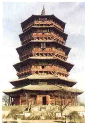
图 1-4 山西应县木塔

交通工程方面:秦统一六国后,以咸阳为中心修建了通往全国各郡县的驰道,形成了全国的交通网。在欧洲,罗马帝国也修建了以罗马为中心的道路网,包括 29 条主干道和 322 条联系支线,总长度达 78000 km。