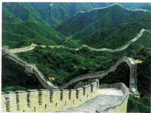
图 1-5 万里长城