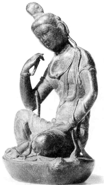
1 唐铜思惟菩萨坐像

的雕刻。名曰“思惟菩萨”，是因为佛像中一手支颐，仿佛进入沉思是常见的题材。而此像以膝承肘，手指去面颊尚有一段距离，俯首含胸，两足随意交搭，全身松弛，大有倦意。因此与其称之为思惟菩萨，倒不如说她是一个工作劳累，睡眠惺忪，不由得想再打个盹儿的少女。