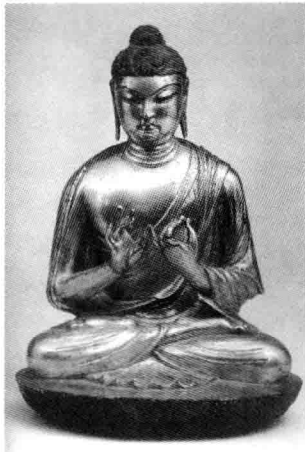
插图 1 唐鎏金铜佛

像身披袈裟，头挽高髻，式样与敦煌 384 窟的唐代供养菩萨像的发髻很相似。面部及手、足的铜色深黄，此外全呈绿色，可能是用了不同的合金所以才会出现不同的颜色。衣褶的处理，在同一尊像上似乎运用了不同的手法。股膝之间，线条圆婉。继承了唐代的规矧；肘臂部分，又采用了平面与凹面的表现方法。但二者却非常调和，同样予人自然简练的感觉。佛的面部相当丰满，也有唐代雕塑遗风。高高斜起，挑入鬓角的长眉，睁着的眼睛，使人觉得他不是冥心内敛的，而是在冷静地、积极地