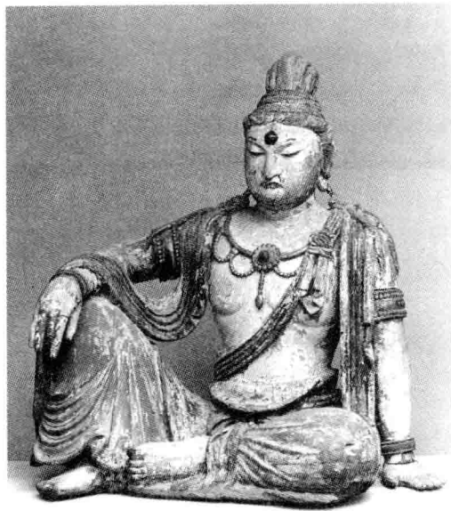
2.2 唐木雕佛坐像(侧面)

见。除垂下来的衣裾飘带可能为移动的便利而遭到断截外,大体上尚完好。佛像面貌丰腴秀朗,是标准的唐代作风。左臂支撑,右臂搭在膝际,手腕听其自垂,体态极为闲适自然。全身的彩色并不暗晦,剥落的地方也不多。颜色积层很薄,肉色之外,以红、蓝、绿为主。设色浓艳,但只觉其庄严厚重而不觉其喧炽。有些地方,表面色层脱落,露出下面的底色,说明此像还是曾经重装过的,但并不像某些古代雕塑那样,由于经俗手重装而遭到了严重的破坏。观察它的设色过程是木胎上先敷一层白色的粉质,上面糊麻纸,纸上又打粉地,然后上面染着颜色。