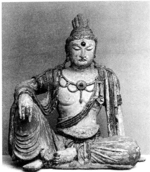
2.1 唐木雕佛坐像(正面)