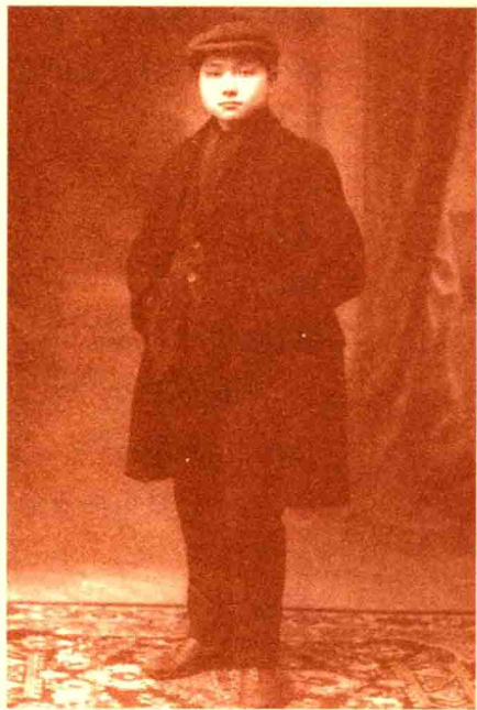
1920年夏，16岁的邓小平赴法国勤工俭学，这是他初到法国时的留影。