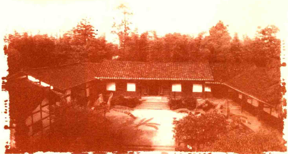
1904年8月22日，邓小平出生在四川省广安县协兴乡牌坊村。图为广安邓小平故居。