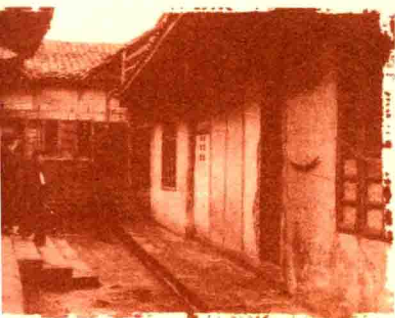
四川广安，邓小平孩提时就读的 协兴小学堂旧址。