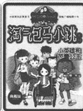
小英雄和芭蕾舞公主