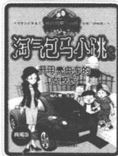
开甲壳虫车的女校长