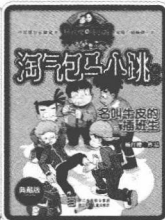
名叫牛皮的插班生