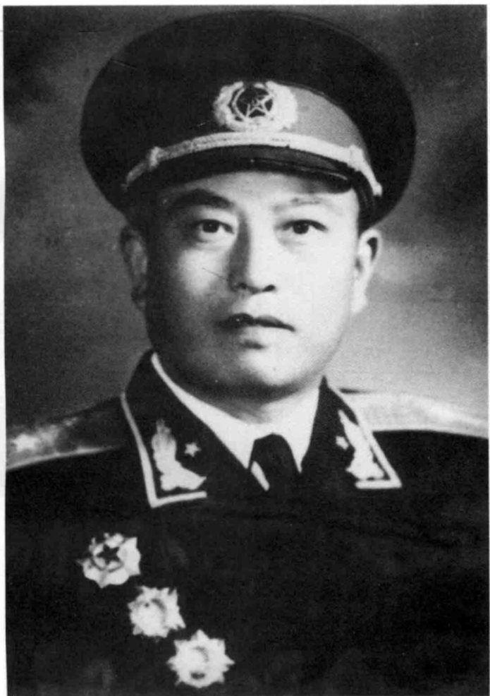
1955年12月，第四十军代军长徐国夫被中央军委首批授予少将军衔。