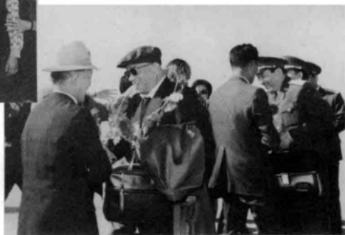
1990年10月,前志愿军代表团参加朝鲜纪念志愿军入朝作战40周年活动结束后,徐国夫将军与前来送行的朝鲜民主主义人民共和国官员握手道别。