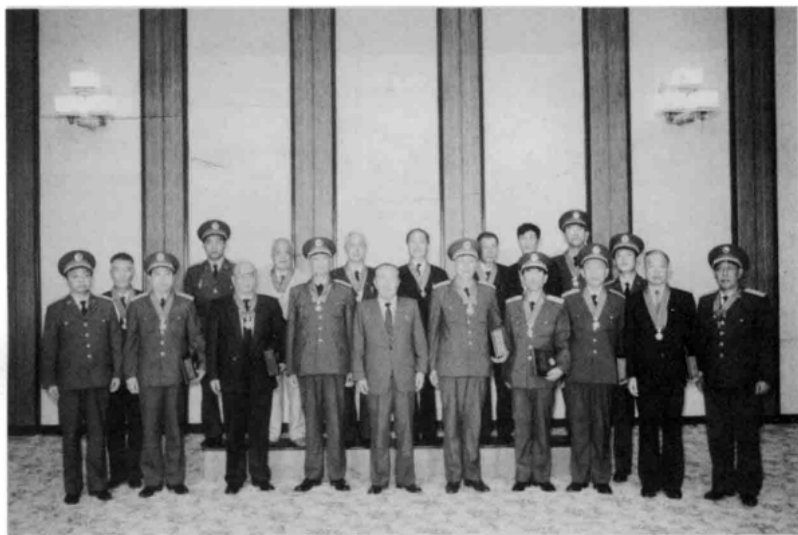
1990年10月,前志愿军代表团应朝鲜民主主义人民共和国之邀,前往平壤参加志愿军出国作战40周年纪念活动,张震任团长,徐国夫任副团长。左五为朝鲜民主主义人民共和国副委员长李金玉。