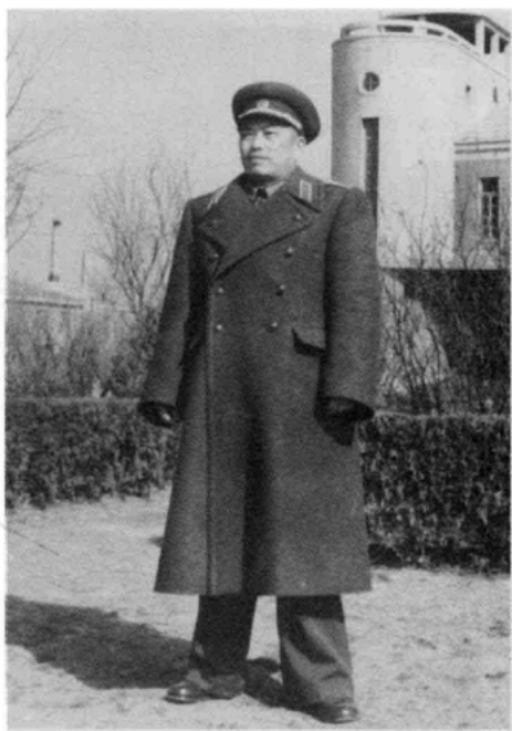
1956年冬,四十军代军长徐国夫于军部办公楼指挥防空塔下立照。