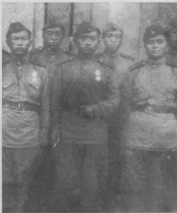
↑ 1945年“八一五”后回东北在牡丹江火车站留影。