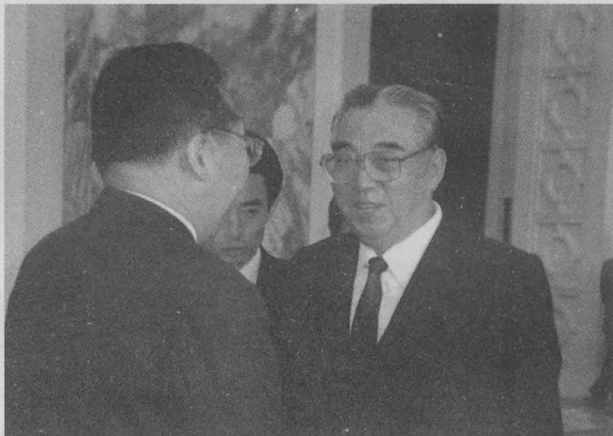
↑ 1992年陈雷访问朝鲜与金日成亲切握手。