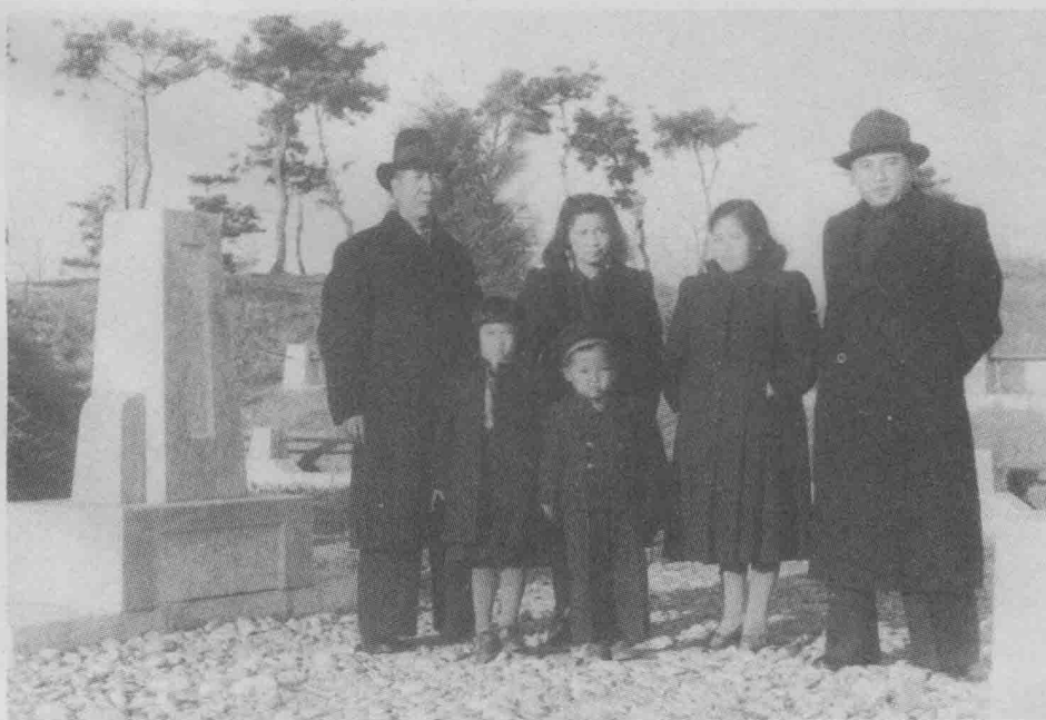
↑ 1948年11月周保中访问朝鲜，在安吉墓前合影。 前排左起：周伟、金正日 后排左起：周保中、王一知、金贞淑、金日成。