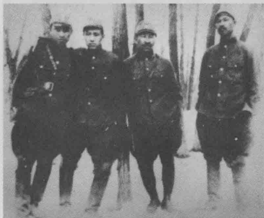
↑ 1941年初小部队活动时期合影。