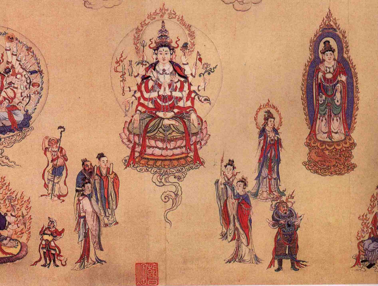
7), 该画 如佛祖、 。观世音