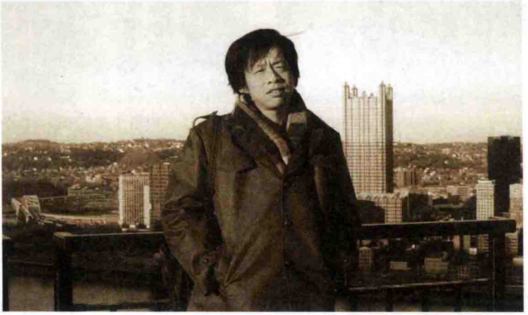
1980年代在匹兹堡大学