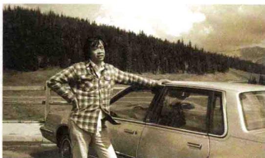
1987年驾车全美旅游途中