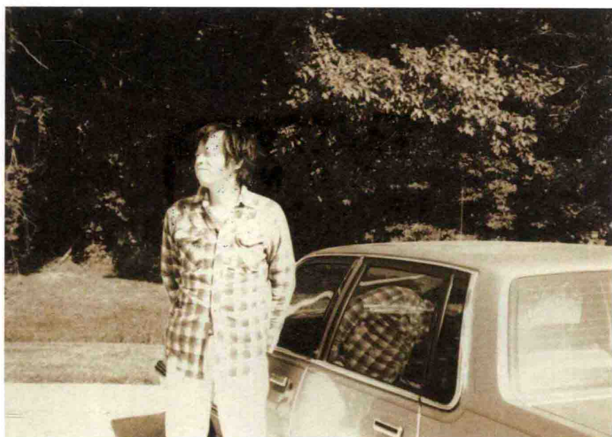
1987年驾车全美旅游途中