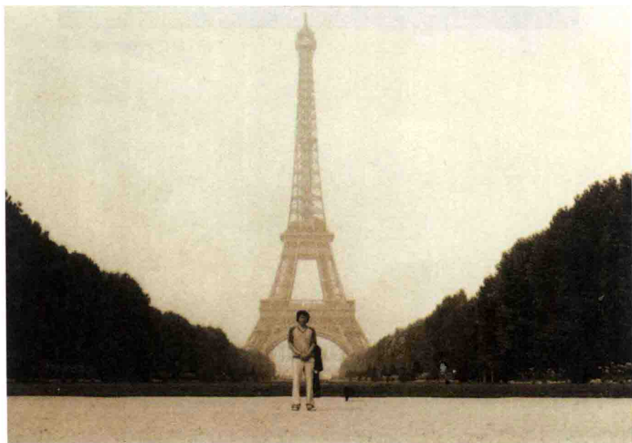
1986年在巴黎埃菲尔铁塔前