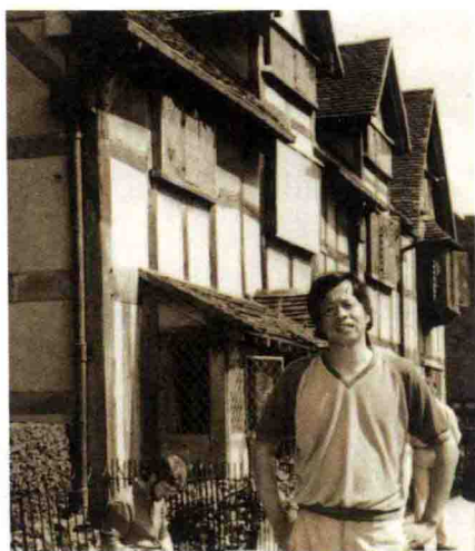
1986年在英国莎士比亚故居前