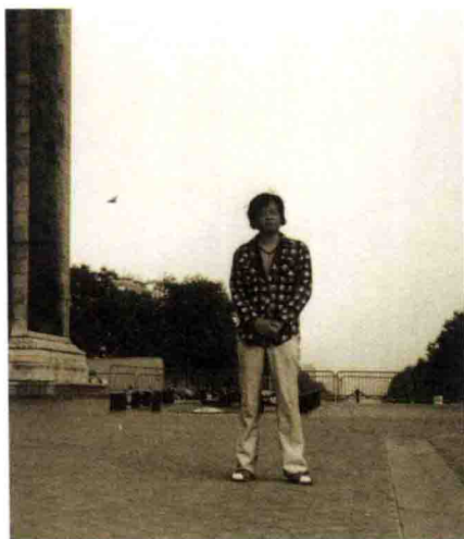
1980年代在匹兹堡大学