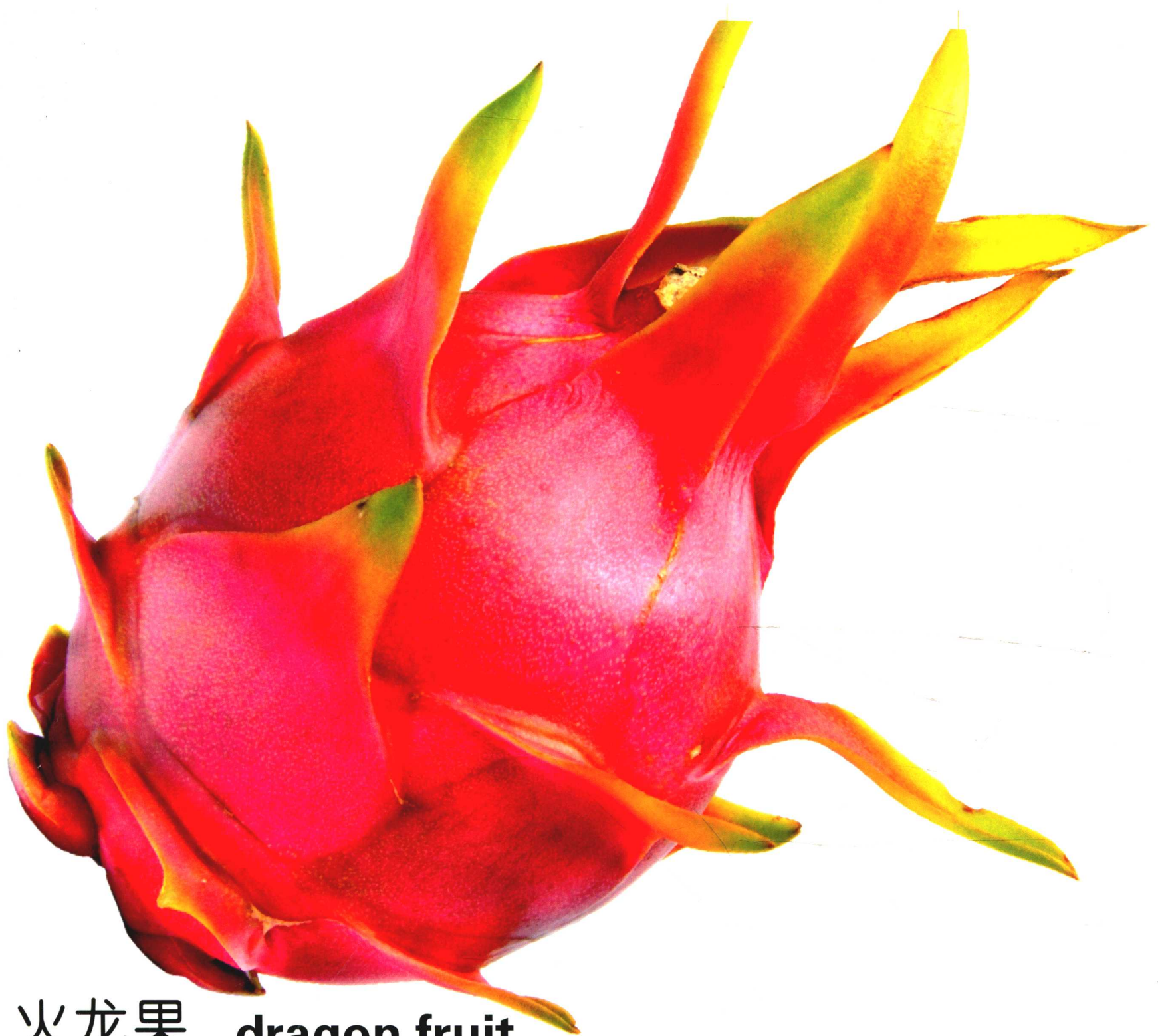
火龙果 dragon fruit