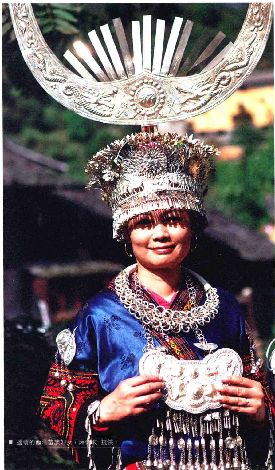
■ 盛装的西江苗族妇女