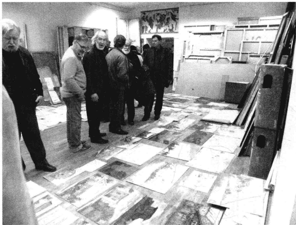
风景写生作品的展示

同时也会作为一种专业经验参与到自身的艺术认知上来。我们的学生极度缺乏这样的知识与经验,其原因就在于展示在我们的教学上没有得到合理的运用或者根本没有真正融入教学中去。而且,以施教者的主观想法去限制学生的作品展示,无形中会对学生的学习热情产生压制。长期被拒绝于正常教学展示之外的学生,客观地说,他们的学习态度一定是消极和胆怯的。然而,我们90%以上的学生都是这种状况。若信心全无,艺术上的创造力又从何谈起?