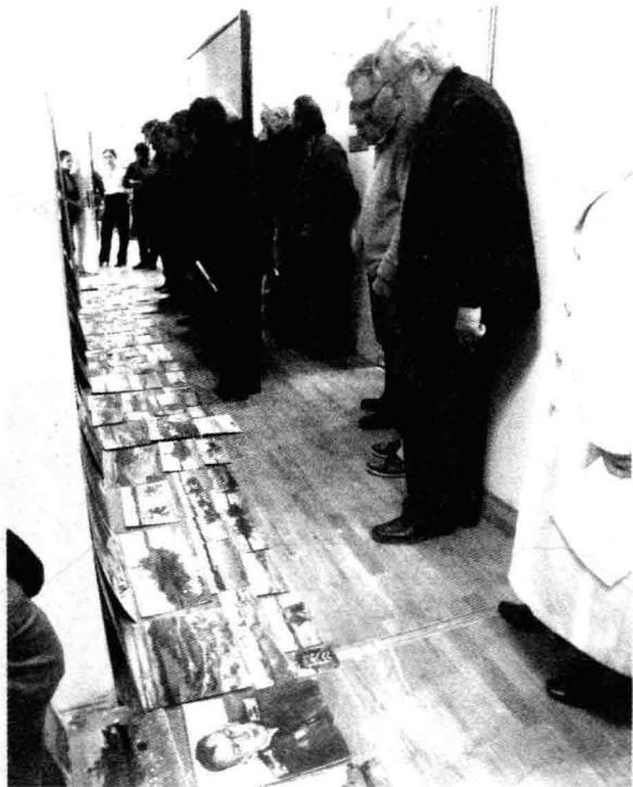
走道上的作品展示(一)

俄罗斯的美术院校每年会有两次面向社会的“开放日”。据说这一传统由来已久。每年的5月份和12月份学期结束之时，学校平日紧闭的大门此时会对外开放，并持续一周的时间。所有社会公众可以在这时候走进校门了解学院的发展历程和现实的教学状况。更重要的是，学校会在此时举办全校范围内的期末展示。所有学生的专业学习状况将以作品展示的形式接受学校学术团的集体评测，并让他们的家人、朋友和参观者看到他们的作品。第一次接触他们的期末展示是在2009年的年末，当时我以国家留学基金委艺术项目的访问学者身份来到莫斯科苏利科夫美术学院，之后不久就恰好碰上了一次大的“开放日”。一般，俄罗斯的美术院校规模不大，能展示的空间也很少，所以在展示期间，学校各工作室的展墙见缝插针，整个学校里铺天盖地全是画作，教室里、走道上参观者熙熙攘攘、人头攒动，那个场景让我颇为震撼，至今仍印象深刻。