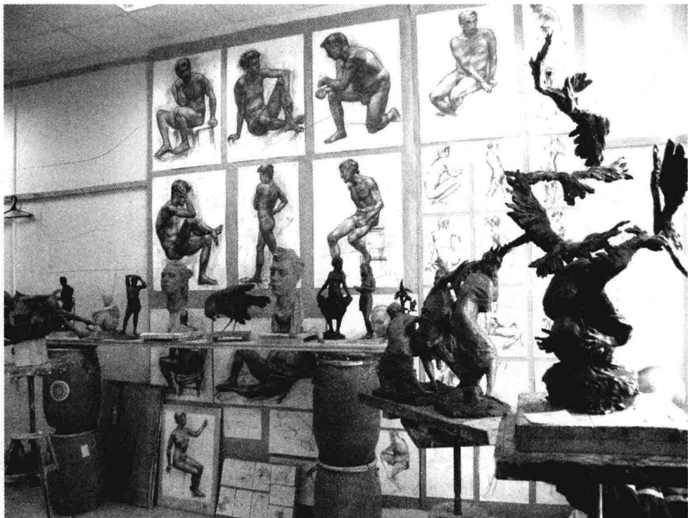
工作室教学的展示

理完善的教学目标。但是如何去确定与之相适应的教学方法、课程、教学制度，如何去有效地执行和实施，最后如何去进行全面、彻底的检测，我认为只有成熟的教学体系才能做到。展示制度正是作为这一体系的一部分发挥着重要的检测作用。它在俄罗斯的美术教学体系中被频繁地运用，其意义已经远远超过本身的作用而被演化成教学手段和管理制度渗透于日常的教学环节中。在俄罗斯的美术院校里，工作室是主要的教学单位。每个工作室都由不同年级的学生组成，工作室的教学由导师全权负责，导师的绘画风格和创作理念直接影响整个工作室的教学方向。工作室的全部课程为创作、素描、色彩。有两位助教分别负责素描和色彩课程的具体教学。其他课程被分离开工作室而成为独立的选修课或必修课。助教的工作需向导师负责。系部主要承担组织管理和相关辅助工作而不直接参与教学。校方管理层负责全校行政事务的处理，也不参与教学，校长在任期内不能主持工作室教学。对全校教学上的管理，则由权威教授组成的学术团来行使最终的调控权。我们可以从以上看到一个清楚的教学组织结构：学生—助教—导师—学术团。单元组成的关系极为简单，就是专业教学。每一个上级单元对下级单元的管理方式也很简单，就是教学检测。作品展示是他们教学检测的唯一方式。任何专业的教学都需要行之有效的管理，重点在于