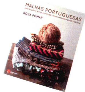
罗莎·波马尔出版的书