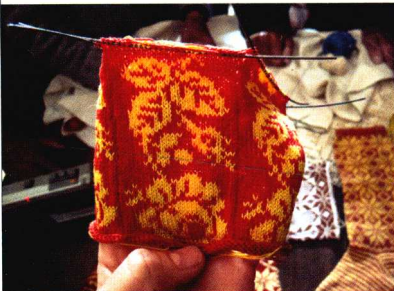
传统的葡萄牙配色花样图案

《葡萄牙编织的历史与传统》 http://retrosaria.rosapomar.com/products/malhas-portuguesas