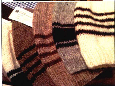
上/出生于1909年的赫莉芙 下/她的作品非常实用

撰稿 / 小仓悠加(音乐评论家) http://icelandia1.exblog.jp/7244988/