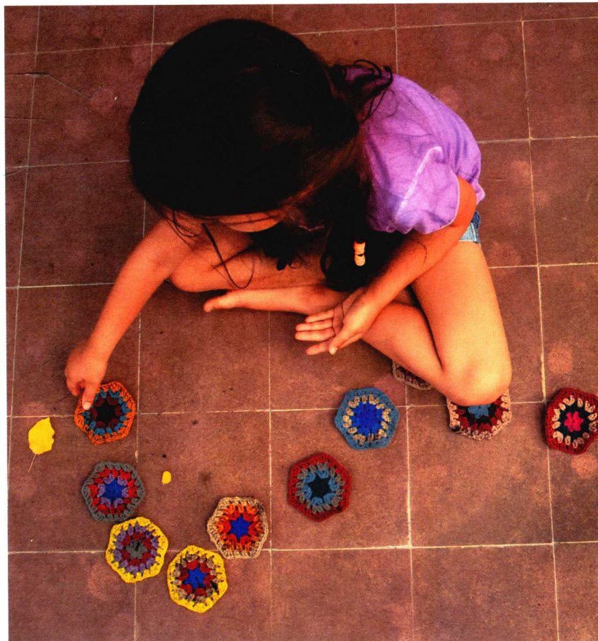
使用贝依罗毛线钩织的花片