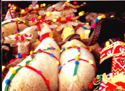
在村子的节日庆典中，小羊们也被打扮了起来