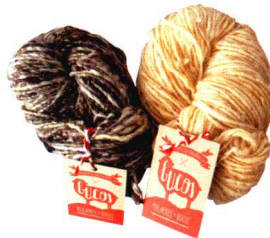
使用葡萄牙羊毛手纺而成的毛线