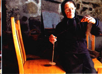
在皮克岛遇到的正在手纺的婆婆