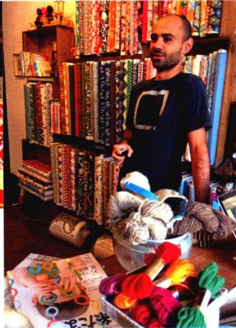
店内居然有之前出版的《毛线球》！