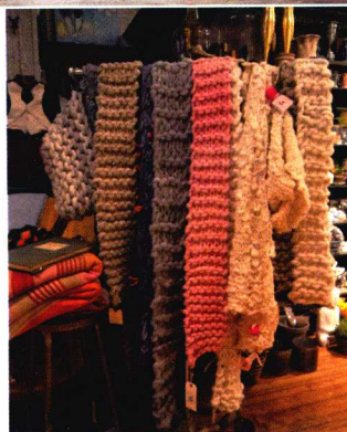
上/像生活用品店一样的展示橱窗 下/天然有机毛线富有弹性，并具有光滑、柔软等优点

现在，他们的毛线还出口至羊毛大国澳大利亚、中东的科威特等地方，让超级粗的毛线从纽约的苏豪区走向了世界。