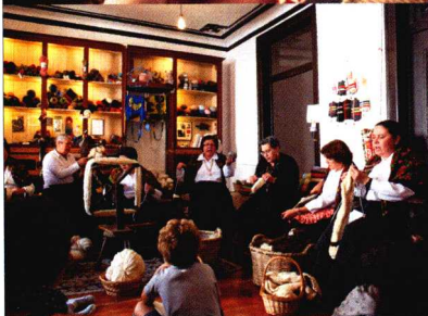
正在Retrosaria店内编织的女人们