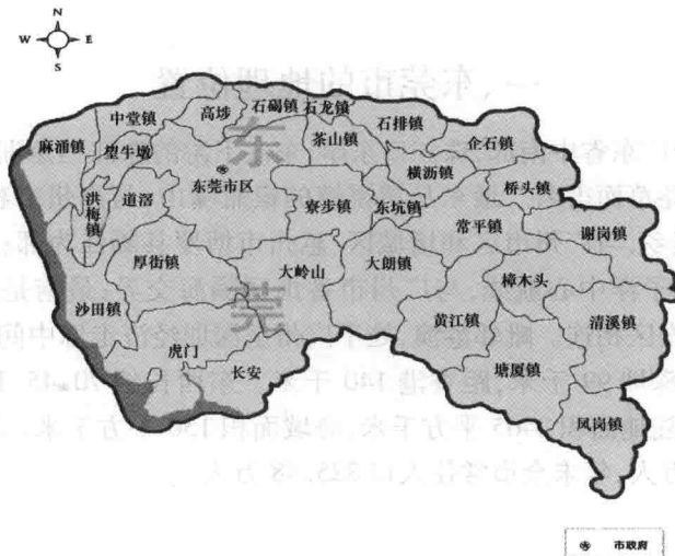
图 1-2 东莞市区 32 个镇分布图

东莞市有 32 个镇区以及松山湖和虎门港两个直辖区,32 个镇区按习惯以其地理特点分为东南部的山区片、中南部的丘陵片、东北部的埔田片、西北部的水乡片和西南部的沿海片。其中,山区片有黄江、樟木头、谢岗、塘厦、清溪和凤岗;丘陵片有城区、东城、南城、寮( liáo )步、大岭山和大朗;沿海片有洪梅、道滘( jiào )、厚街、沙田、虎门和长安;水乡片有麻涌、中堂、望牛墩、高埗( bù )、万江、石碣( jié )和石龙;埔田片有东坑、茶山、石排、横沥、企石、桥头和常平。各镇历经多年的发展早已在城市基础设施、生产、生活方式等方面具备了城市化的经济基础,绝大部分户籍居民经济来源或是商业,或是依靠出租屋,或是拿着农村集体企业的股份分红,经济基础已经彻底改变。