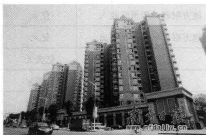
图 1-4 东莞新建的某小区

2011 年固定资产投资总额 1079.77 亿元,同比增长 8.1%,增速比上半年提高 1.5 个百分点。其中,房地产开发投资 373.76 亿元,增长 25.0%,增势强劲;全市商品房网上签约销售面积为 512.20 万平方米,同比增长 16.6%;销售金额 418.83 亿元,增长 25.4%。从登记注册类型看,民营经济投资 460.07 亿元,增长 17.7%;港澳台经济投资 140.12 亿元,增长 25.3%。从产业分布看,第二产业完成投资 351.30 亿元,同比增长 1.9%,占固定资产投资的 32.5%;第三产业完成投资 727.87 亿元,增长 11.3%,占固定资产投资的 67.4%。