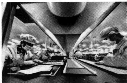
图 1-3 工业企业生产线

亿元,占 53.4%,增长 8.0%。全年全市规模以上五大支柱产业完成增加值 1249.87 亿元,增长 8.0%,略高于规模以上工业平均增速;四个特色产业完成增加值 187.21,下降 2.6%。规模以上电子信息制造业增加值 692.48 亿元,增长 10.7%;实现利润总额 93.98 亿元,增长 5.9%。