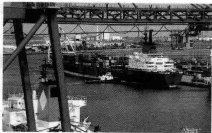
图1-6 东莞市虎门港外景

全年机电产品出口556.16亿美元,增长12.4%,占出口总额的71.0%;高新技术产品出口273.42亿美元,增长13.0%,占34.9%。