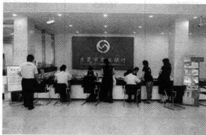
图1-7 东莞市商业银行服务大厅

2011年来源于东莞的财政收入838.52亿元,比上年增长16.2%;市财政一般预算收入313.07亿元,增长18.3%。全年税收总额843.57亿元,增长17.9%。其