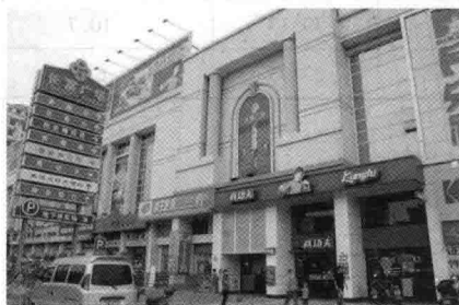
图 1-5 东莞市南城区银丰路美食街

2011 年社会消费品零售总额 1266.31 亿元,比上年增长 15.0%,扣除物价因素影响后,实际增长 9.8%。其中批发零售业零售额 1150.61 亿元,增长 15.2%;住宿餐饮业零售额 115.70 亿元,增长 13.5%。从限额以上商品零售的类别来看,服装鞋帽、针、纺织品类增长 26.7%;日用品类增长 12.3%;机电产品及设备类增长 31.9%;汽车类增长 20.3%;石油及制品类增长 19.4%;食品、饮料、烟酒类增长 17.8%。