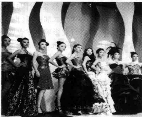
图 1-8 虎门服装展