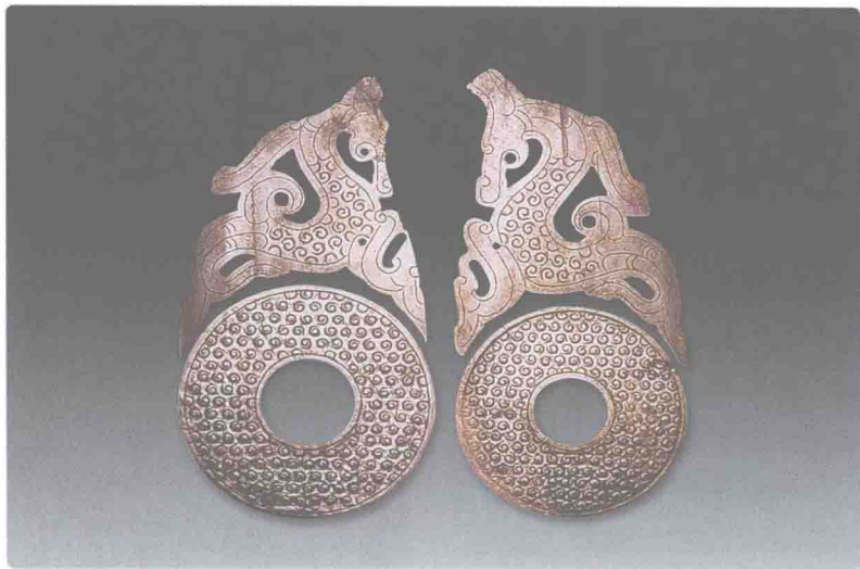
龙马形玉佩谷纹对璧

到了汉代，宝玉石文化又进入了振兴发展转折期。汉代盛行人物形玉佩，较常见的有玉舞人和玉翁仲两种。玉舞人是汉代常见的佩饰，舒袖舞动、翘袖折腰是这一时代的特色；玉翁仲采用汉代风格的“汉八刀”雕琢方法，大多为长须大袍、头戴平冠的老者人物，生动显示出汉代艺术朴实无华的特点。