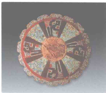
10 ~ 13 世纪的珠宝嵌饰圆盘， 直径 24 厘米

特别是近十年来，宝玉石业在材料来源、艺术造型、加工技术、合成生产、最终验定、科学研究以及技术人员和雕琢名师的培养方面都取得了很大成就，有力推动了国内和国际珠宝市场的发展，使我国的宝玉石业出现了空前的繁荣。