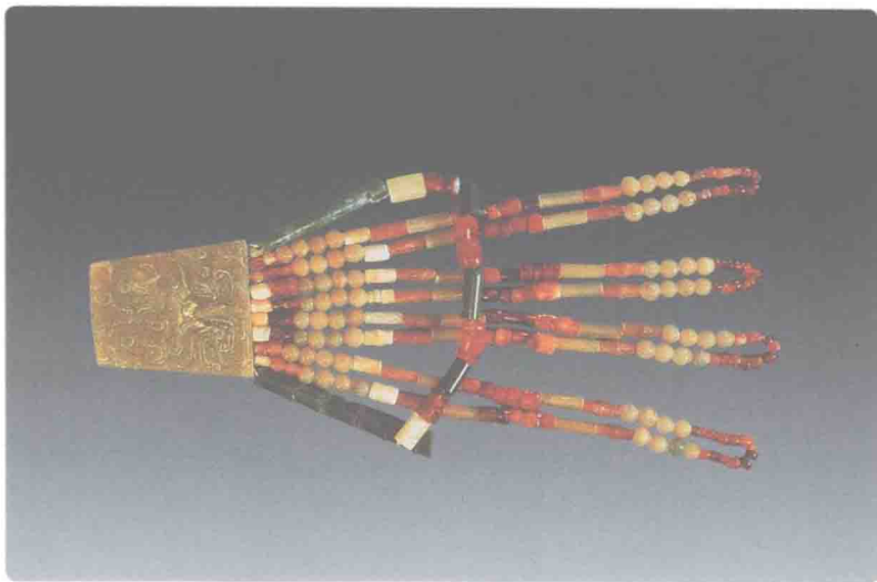
由玉、玛瑙和数十枚玉珠、玉管组成的西周饰品

文化、古墨西哥尤卡坦地区的玛雅文化……珠宝玉石文化，作为最主要的元素，和人类幸福美好的社会发展共咏着和畅、和美、和谐、和悦的和声。