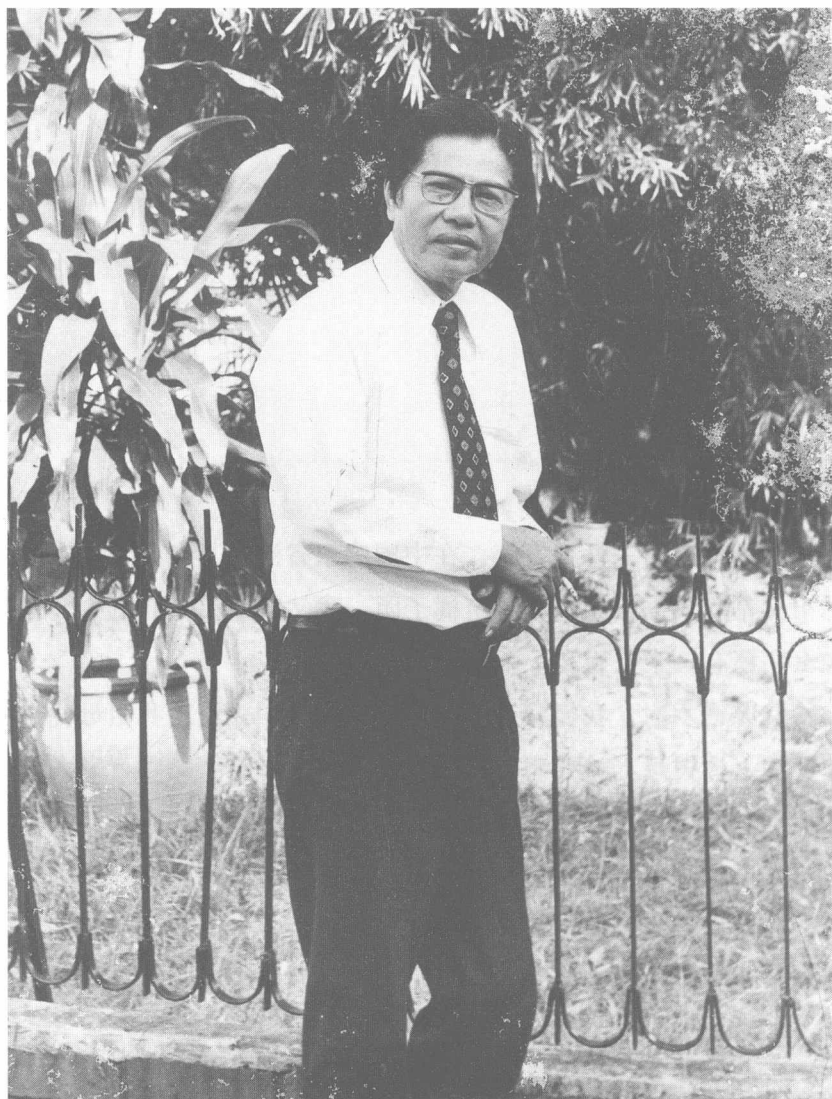
父亲文学根底很好，文章写得好又会绘画，常得师长赞赏。（摄于1978年）