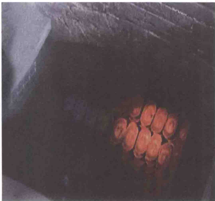
◎ 官僚富豪藏在窖中的金银财宝

南北朝时期，有的富豪将自家的钱财寄放在亲朋好友那里，这种储蓄观念的变化为金融中介的产生提供了前提条件。说到放