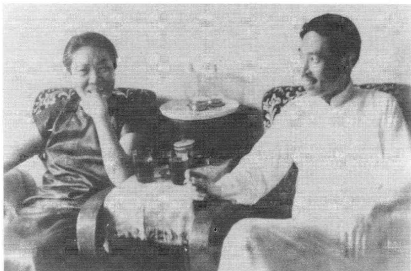
茅盾夫妇在大陆新村