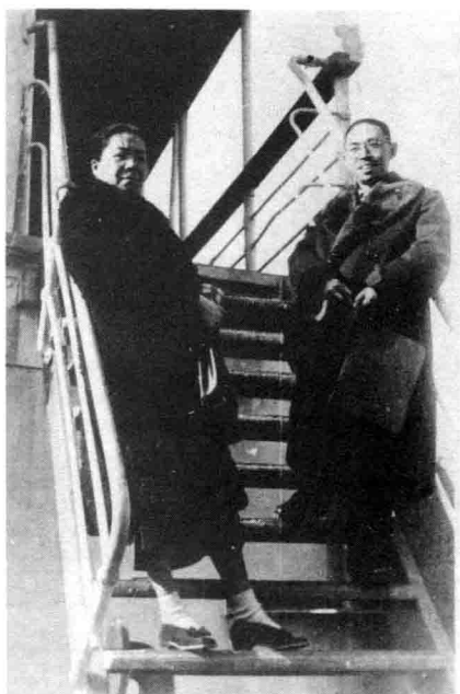
1946年12月5日茅盾夫妇应 苏联对外文化协会邀请赴苏 联参观访问