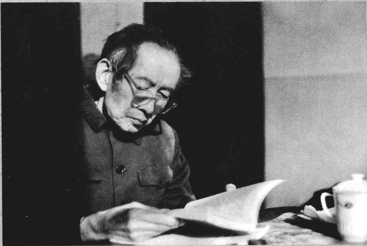
|| 1987年在成都红星路2段87号家中读书