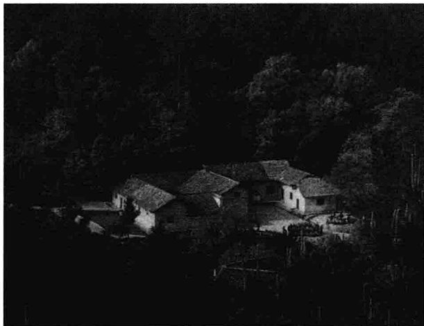
韶山毛泽东故居。 1893年12月26日，毛泽东 出生在这座普通农舍里。

虽然家境还算不错，但是农民的儿子是不能娇生惯养的，必须要养成勤劳的习惯。在毛泽东6岁的时候，父亲毛贻昌就带着他下地学习譬如送秧苗、除杂草、送肥等简单的农活了。父