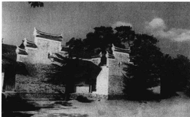
韶山南岸私塾旧址。1902年毛泽东8岁时发蒙于此，他先后进6所私塾读了6年书。

在私塾念书时，毛泽东由于离家不远，本来可以不带中午饭，因为发现有个家里很穷的名叫黑皮伢子的同学离家最远却不带中午饭，而一些较近的同学都带了中午饭时，毛泽东便向母亲提出带中午饭的要求。母亲感到奇怪，就问：“你带饭干