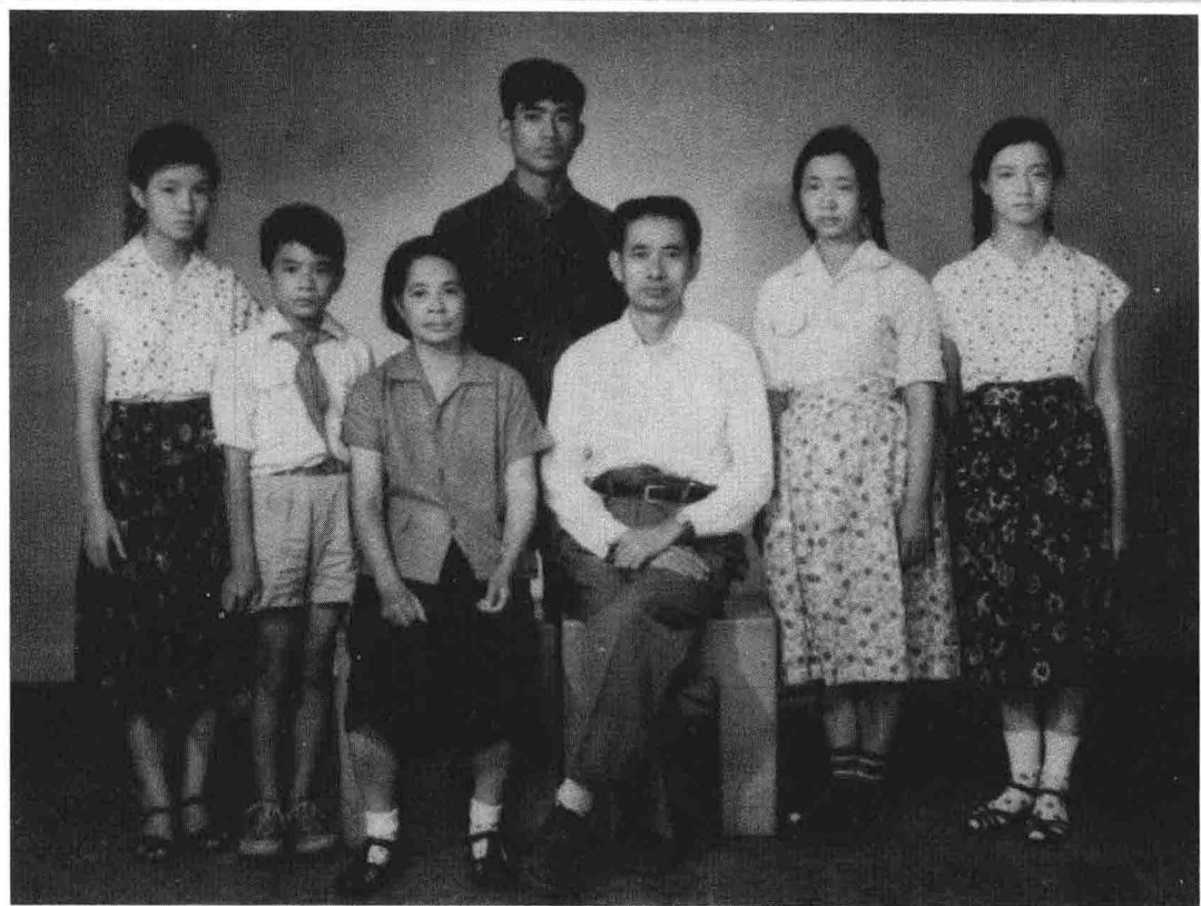
|| 全家福50年代摄于北京