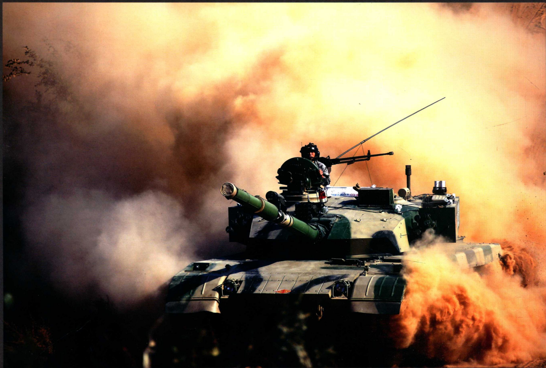
10月11日，南京军区某部组织部队进行实兵对抗训练，围绕通信组网、系统运用、精准射击、克服障碍等重点难点课目，检验部队实战能力。图为主战坦克快速冲击。

坦克集强大的火力、地面突击力与良好的越野机动力、装甲防护力于一身，是陆军信息化作战的重要平台和现代化建设的标志性装备，被称为“陆战之王”。随着96A式坦克和99式坦克等性能先进主战坦克的不断列装，我军地面攻击能力不断提升。