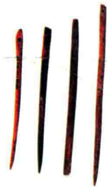
1973年河姆渡遗址T37 和T30出土的骨针