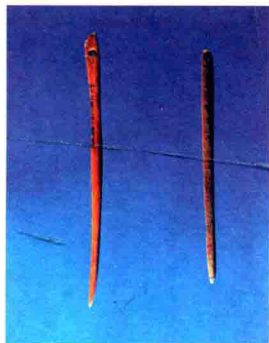
江苏吴江梅埭新石器时 代遗址出土的骨针