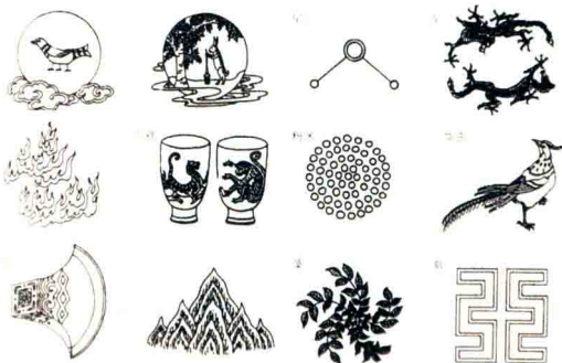
帝王服饰专用的十二章纹。

约4000多年前，中国进入父系氏族社会。私有制的确立，促使章服制度进入初创期，原始彩绣开始被纳入“礼”之轨道。上古文献《尚书》中就有关于“垂衣裳而天下治”的记载：规定天子玄衣纁裳，其上绘绣日、月、星辰、山、龙、华虫、火、宗彝、藻、粉米、黼、黻图案，