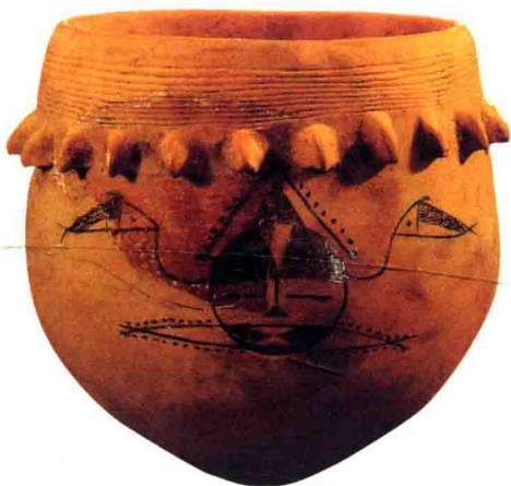
西安半坡类型人面纹彩陶尖底罐。

因此，相传吴国始祖泰伯死后，仲雍不忍后人承受文身之苦，召集众人商议对策，被正在房内低头缝衣的孙女听到，她仔细揣摩起来，一不小心，针扎破手指，血色沾衣。受此启发，小女孩急中生智，尝试在衣服上一针一线刺绣