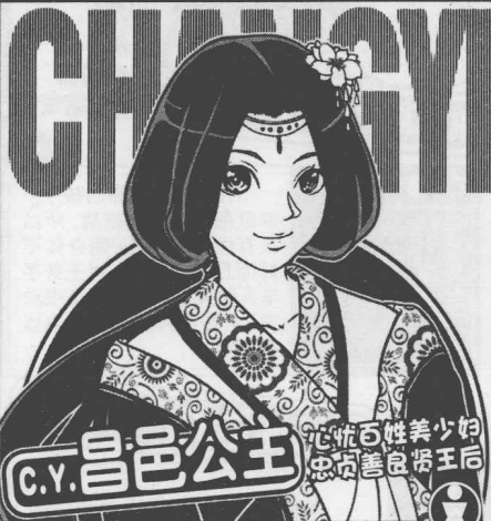
C.Y. 昌邑公主 心忧百姓美少女 忠贞善良贤王后

东汉昭帝年间，楼兰国鄯善王屠耆的御前大将军，是楼兰第一勇士，在护送昌邑公主入西域时两人生出感情，后来，在回国的途中，他们遭遇了巨大的危险，他为救昌邑公主英勇牺牲了！