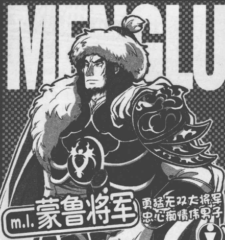
m.l. 蒙鲁将军 勇猛无双大将军 忠心痴情侠男子

齐小圣班上的英语老师，同时还是他们的班主任。潘老师刚毕业没有多久，虽然看起来十分严厉，对齐小圣等捣蛋小孩经常板着一张脸，但是心底里还是对他们很温柔的。