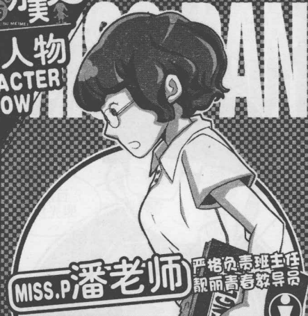
MISS.P 潘老师 严格负责班主任 靓丽青春教导员

齐小圣班上的自然科学课老师，有着丰富的文史知识。平常喜欢看书，和齐小圣等人的关系极好，但是在课堂上绝对是一丝不苟。有爱心的易老师还资助了两个贫困儿童上学。