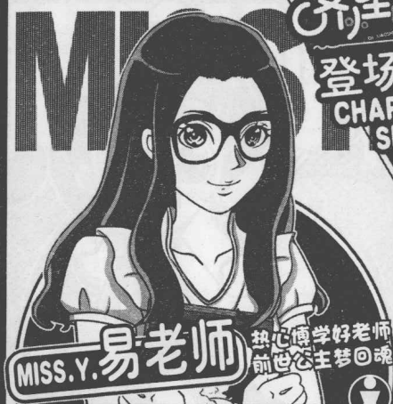
MISS.Y. 易老师 热心博学好老师 前世公主梦回魂