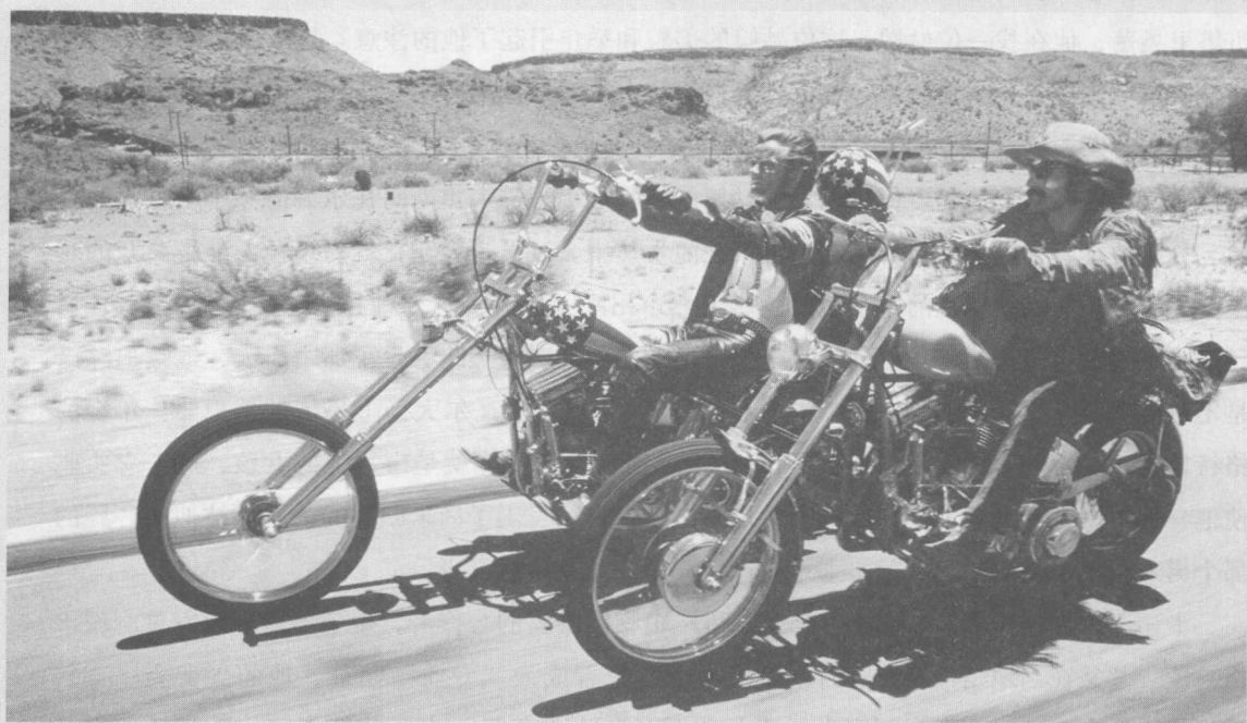
《逍遥骑士》(Easy Rider, 1969)