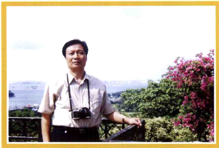
2001年12月，作者在新加坡