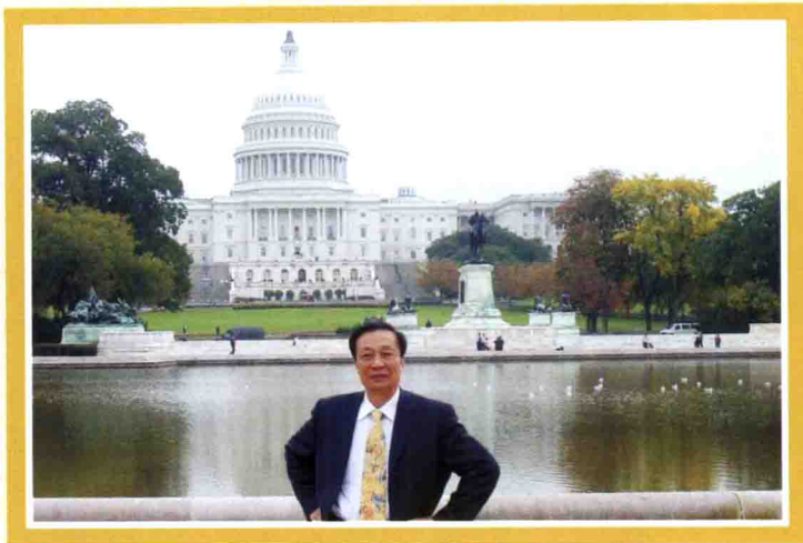
2006年10月，作者在美国华盛顿