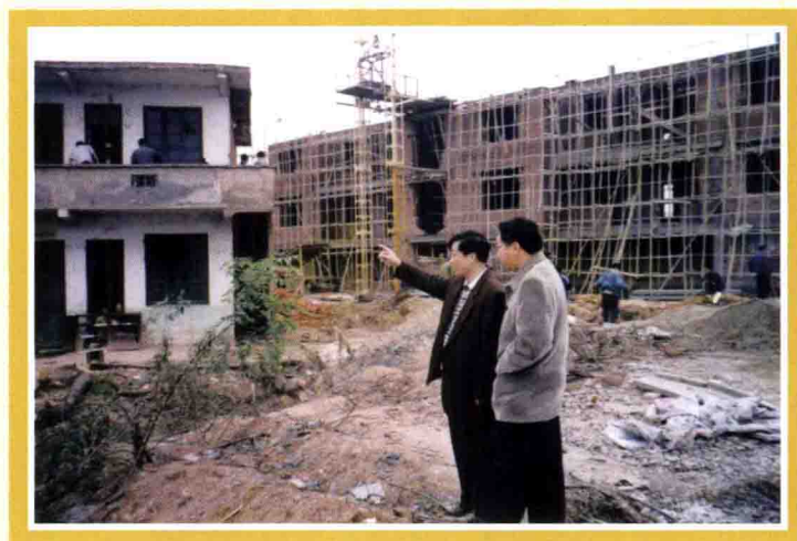
2002年，作者实地察看廉租房建设和拆迁安置情况