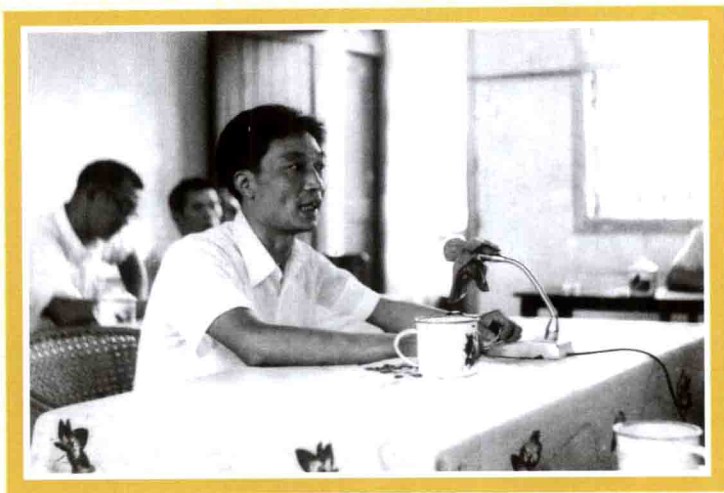
1984年，作者任零陵县教育局局长时在全县教育工作会议上讲话