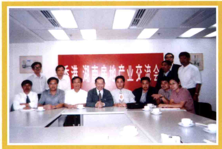
1999年12月，作者在香港与同行交流房地产开发管理经验