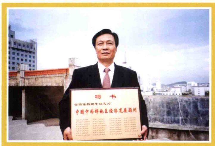
2000年，作者被聘为中国中西部地区经济发展顾问