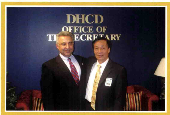
2006年10月，作者在美国与马里兰州房产部长合影