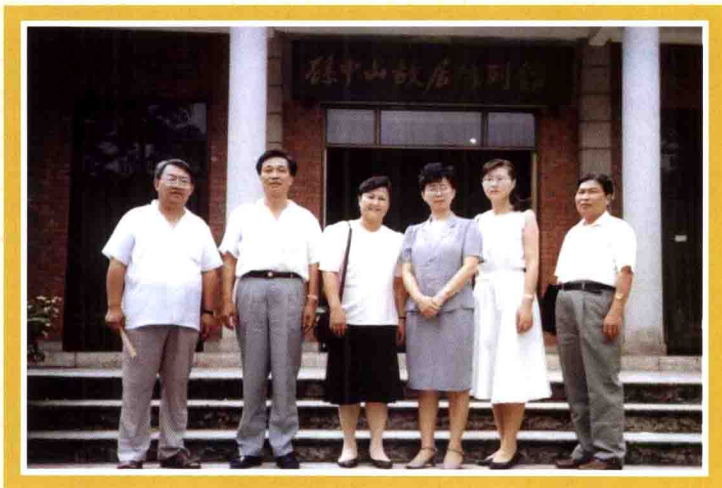
1991年7月，作者陪同副省长潘贵玉（右三）在广东考察