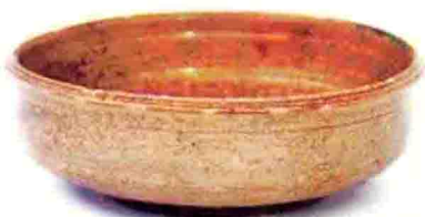
阖闾城遗址出土文物