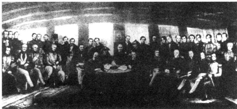
◎1842年8月29日英国强迫清政府签订中国近代史上第一个不平等条约——《南京条约》

争。每一次的入侵，都使中国山河破碎；每一次的战争，都使中国人民生灵涂炭。屡吃败仗的清王朝统治者被迫同西方列强订立了一系列割地、赔款、让权的屈辱卖国条约。尽管中国在形式上还保持着独立，但实际上逐渐形成了被西方列强共同宰割的局面。外国侵略者在中国强行划分势力范围，不仅取得了在中国设立工厂、开采矿山、修筑铁路、设立银行、经理航运等特权，而且取得了驻扎军队、设立租界、领事裁判等特权。这样，外国侵略者既控制了中国的财政经济命脉，也操纵了中国的政治军事大权，中国逐步变成了一个半殖民地的国家。