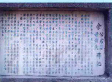
普庵禅师父母墓碑文