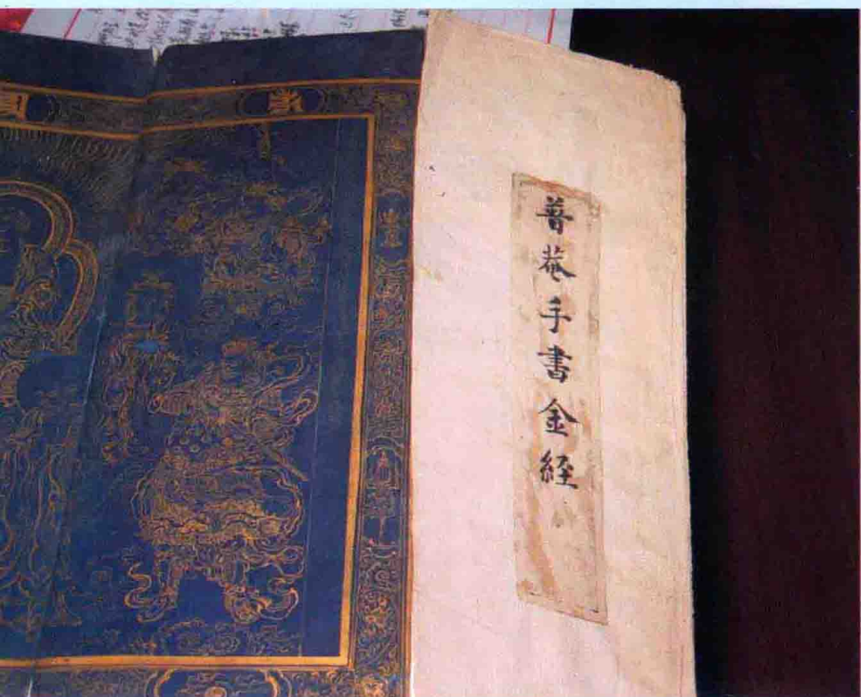
普庵禅师手书《金刚经》