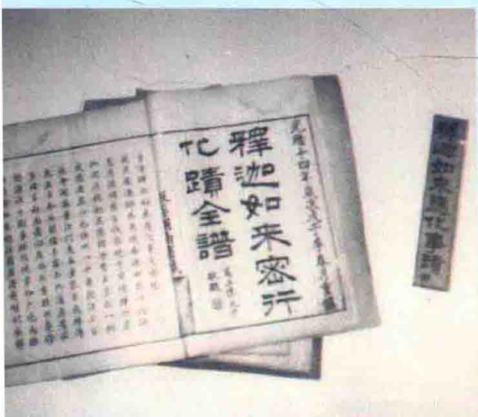
释迦如来密行化迹全谱