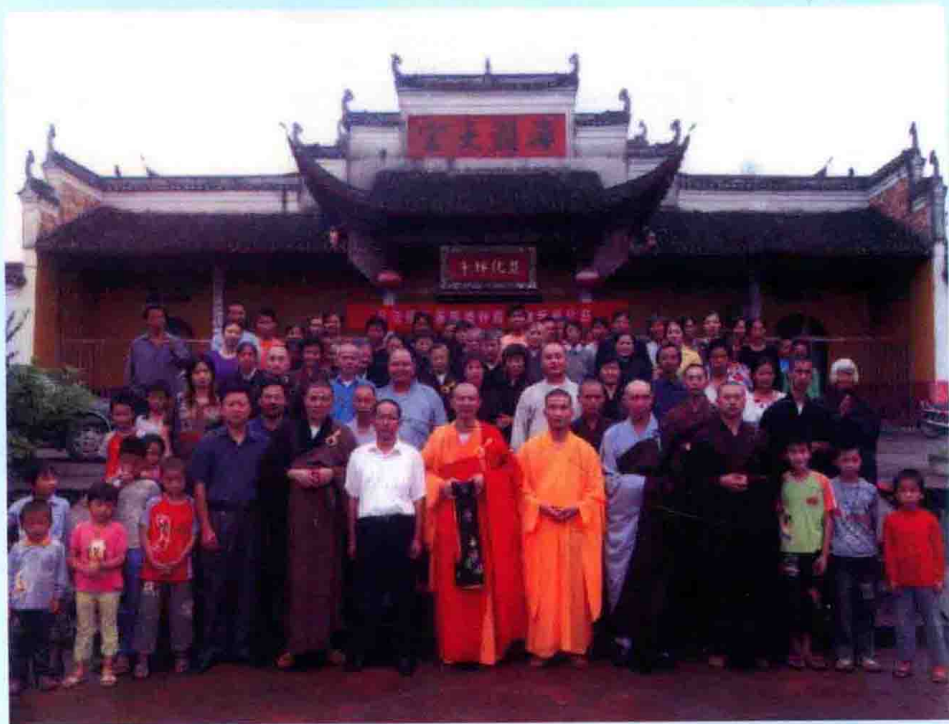
慈化禅寺伽蓝殿钟楼奠基祈福法会