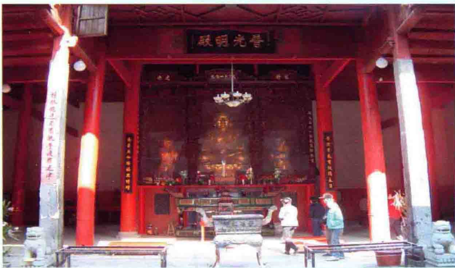
普光明殿（供奉普庵禅师）