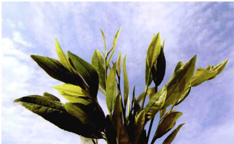
茶 的 故 事