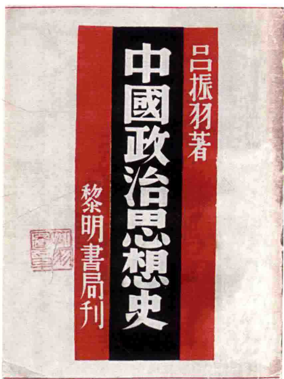
《中国政治思想史》1937年初 版书影