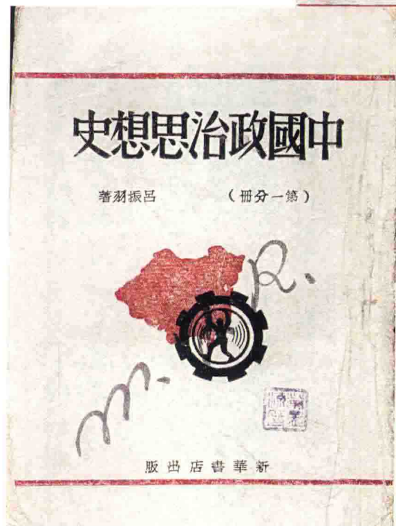
《中国政治思想史》1945年延 安版书影