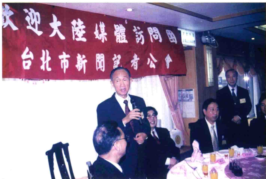
▲ 民國八十七年，時任台北市新聞記者公會理事長，與大陸媒體訪問團餐會合影。