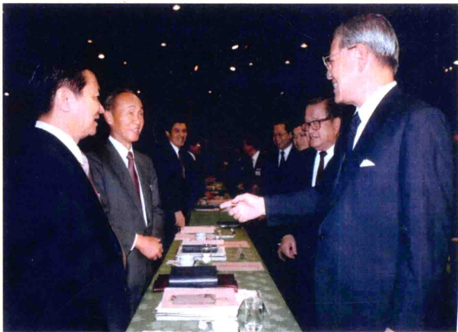
▲ 民國七十九年，出席國是會議，與李前總統等。