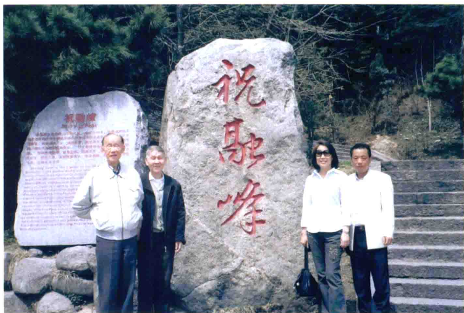
▲ 民國九十七年，與家人合影於南嶽衡山最高之祝融峰。