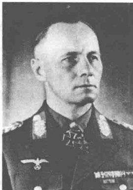
隆美尔 Erwin Rommel

西线德军地面部队共58个师（含老弱官兵编成的海防师33个），编为伦德施泰特指挥的“G”集团军群和隆美尔指挥的“B”集团军群。