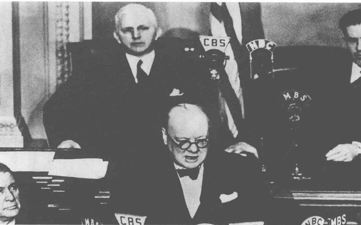
▲ 丘吉尔在美国国会发表演讲。

在严格保密的状态下（连远程航空兵副司令官都不知道），一架佩-8式四引擎轰炸机被调到莫斯科，几名王牌飞行员被秘密调到这里，经过一个多月的工作，一切准备就绪。