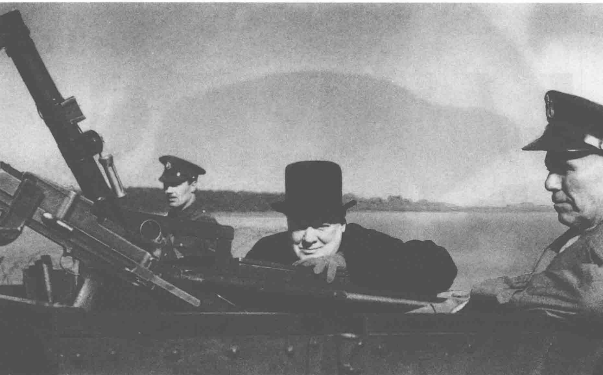
▲ 1942年，马歇尔（右）奉罗斯福之命赴伦敦与丘吉尔等英国高官商议未来的作战计划。