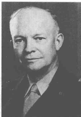
艾森豪威尔 Dwight Eisenhower

盟军参战总兵力约288万人，其中地面作战部队约153万人，共39个师（步兵师26个、装甲师10个、空降师3个），10个旅；舰艇9000余艘，飞机13000多架次。