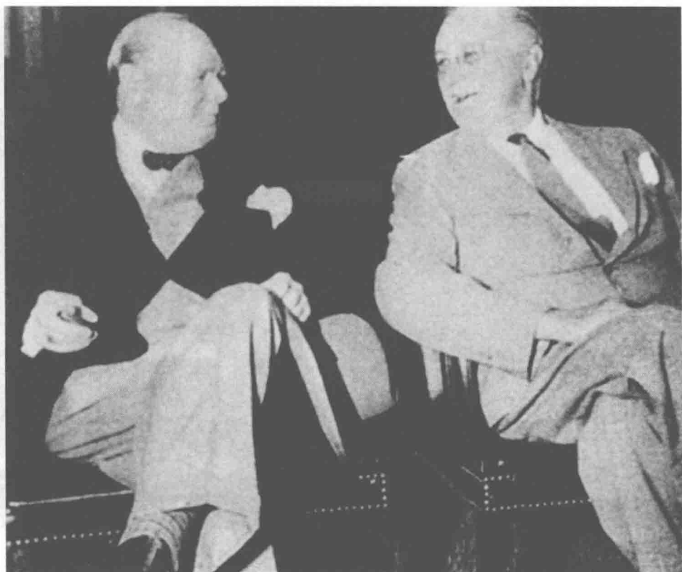
△ 1942年，罗斯福与丘吉尔在华盛顿会晤，商讨在欧洲大陆开辟新战场的事宜。

想把“铁锤”计划付诸实施。为此，马歇尔向丘吉尔全面概述了“铁锤”作战计划，听后，丘吉尔满面春风地举杯向客人说他“完全赞成这个计划”。