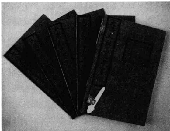
清太祖高皇帝实录之叶赫挑衅

首的“九国之兵”，取得了著名的“癸巳大战”的胜利，不仅俘获大量人畜财物，也为缔结婚盟提供了契机。万历二十五年，海西四部女真遣使通好，“我等不道，兵败名辱。自今以后，愿复缔前好，重以婚媾”。就在这一年，乌拉贝勒布占泰为了保住自己的地盘，只好依附努尔哈赤。无奈之中，竟将胞兄满泰贝勒年仅十二岁的女儿阿巴亥嫁给年长三十一岁的努尔哈赤为妻，此女就是历史上有名的大妃乌拉纳喇氏。