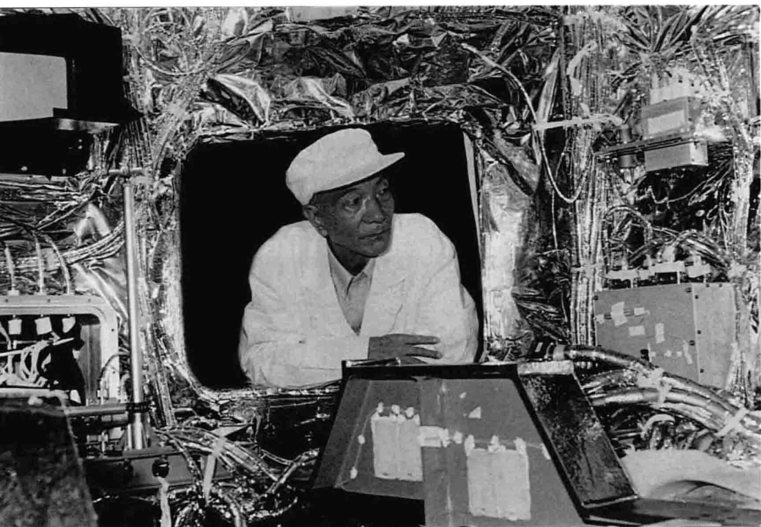
20世纪90年代，王希季在卫星总装现场