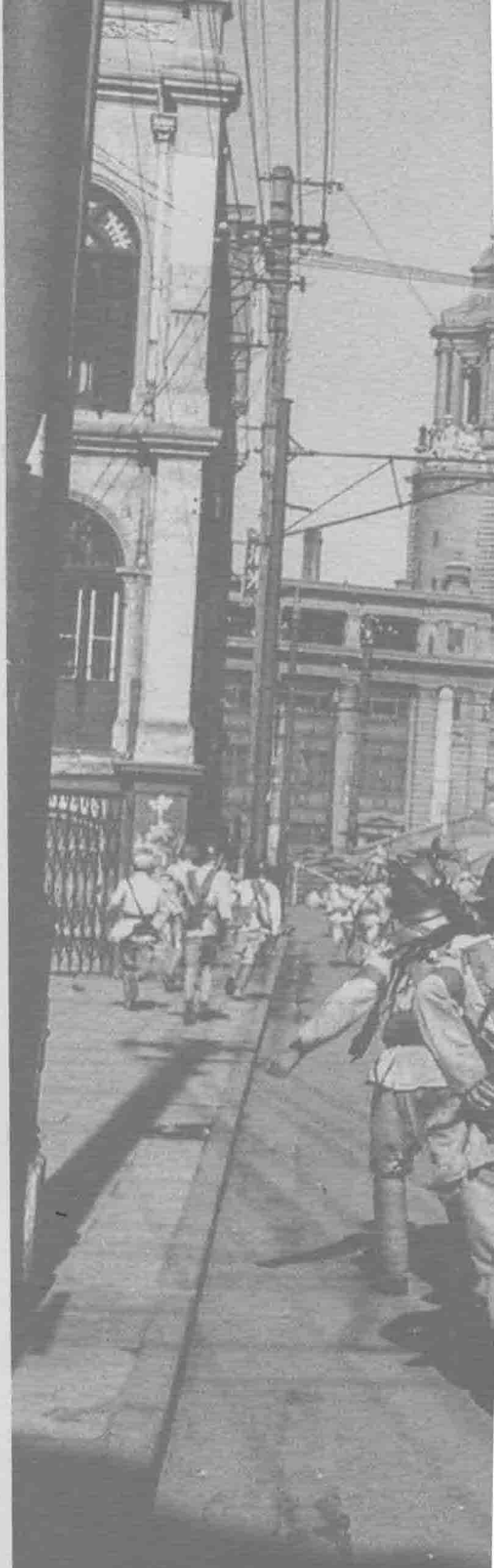
1949年10月24日，驻沪部队举行 大演习，重温解放上海的壮举