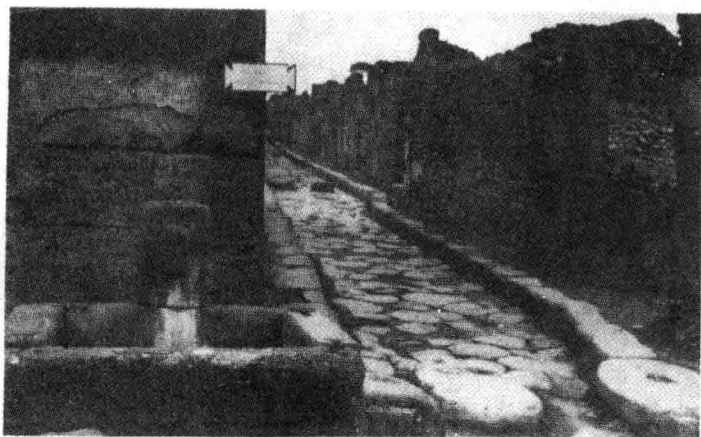
●義大利，龐貝城廢墟