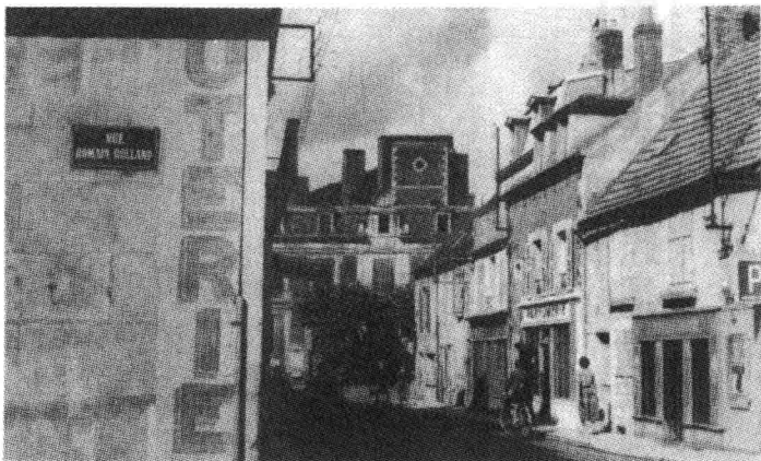
● 克拉姆西以羅曼羅蘭命名的街道