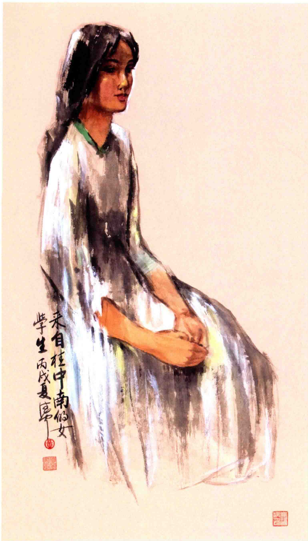
来自桂中南的女生 136 cm × 68 cm