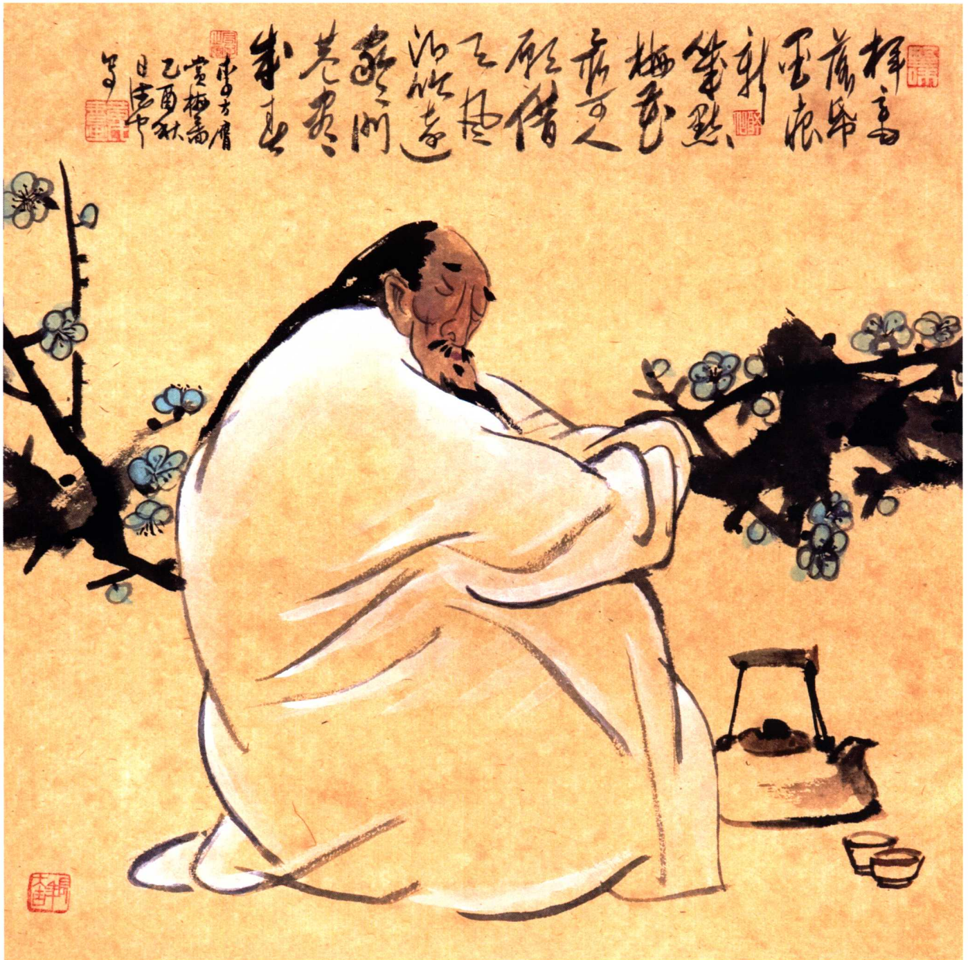
李方膺小像 68 cm × 68 cm