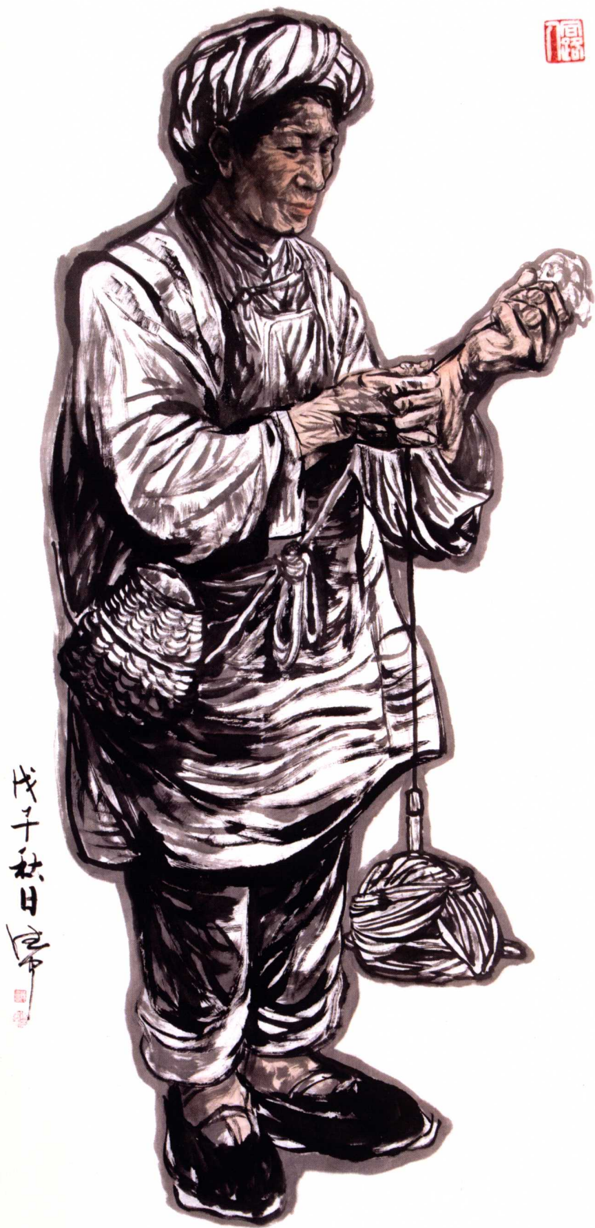
捻 185 cm x 92 cm