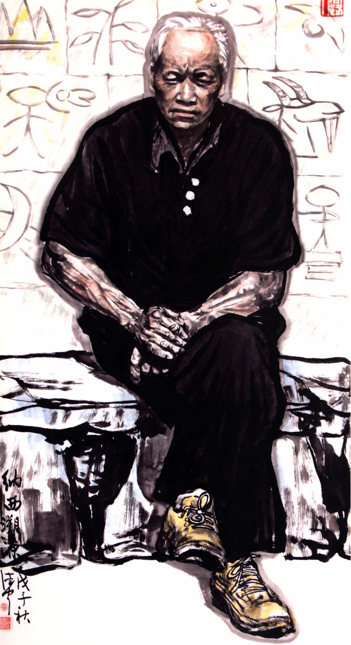
纳西溯源 185 cm x 92 cm