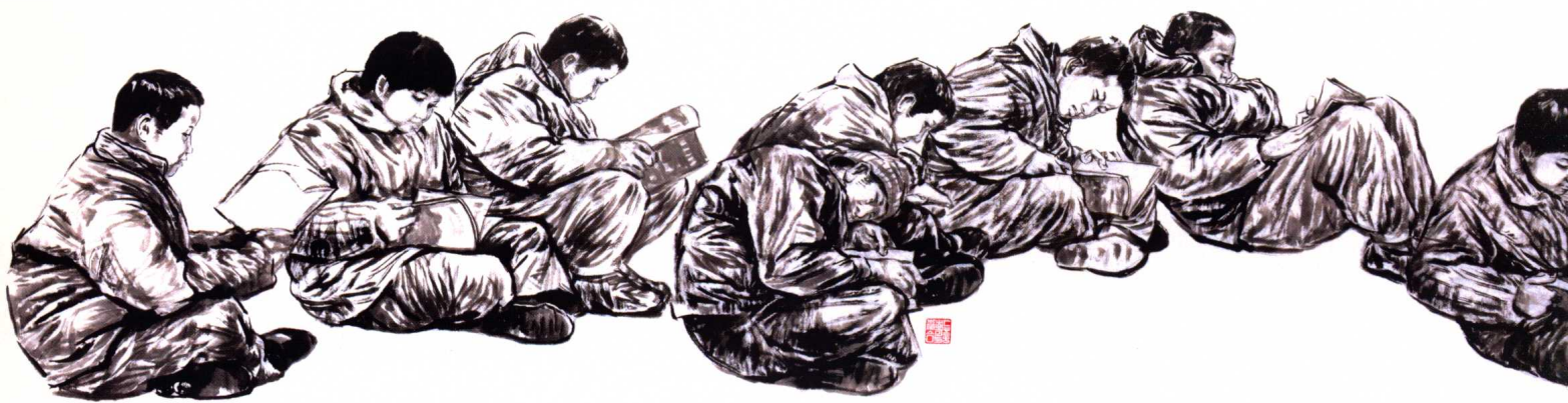
书店见闻 68 cm × 550 cm