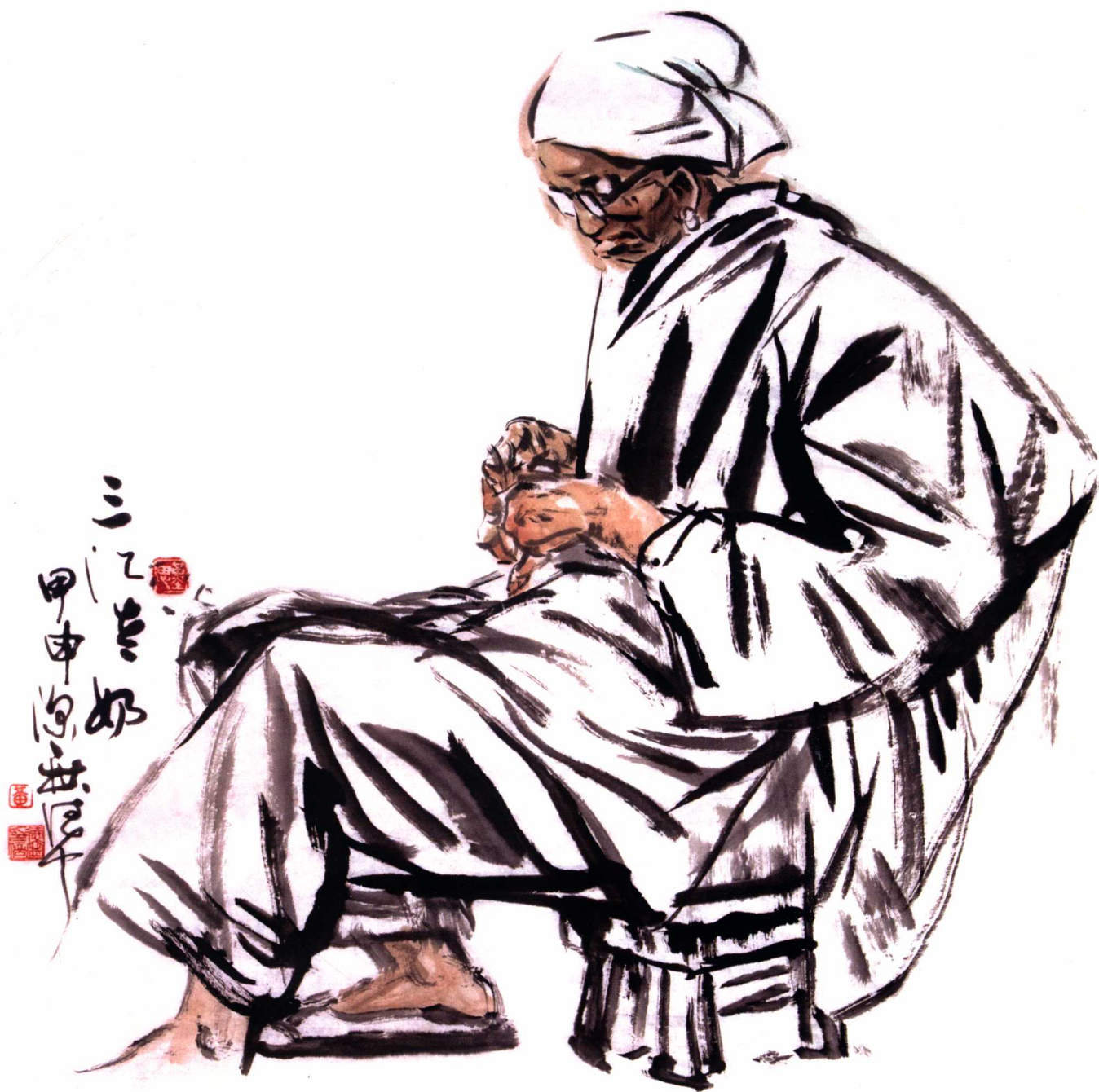
三江老奶奶 90 cm x 93 cm