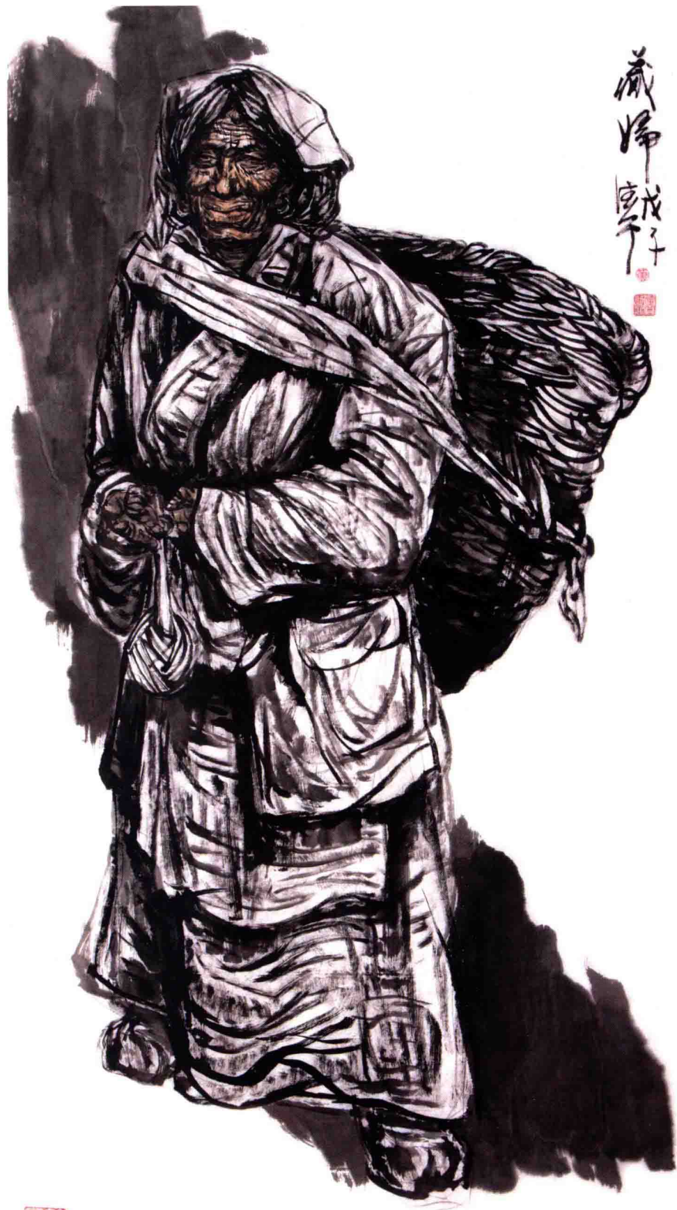
藏族妇女 185 cm x 92 cm