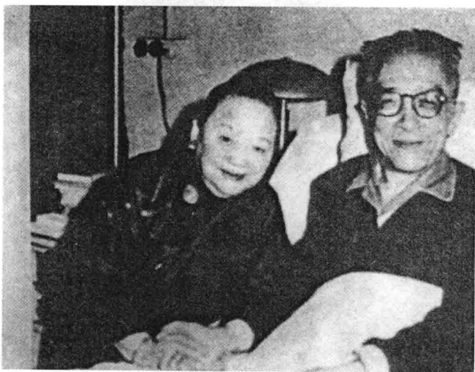
胡适与夫人江冬秀 (1961)