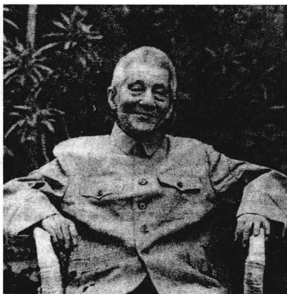
晚年的罗尔纲先生