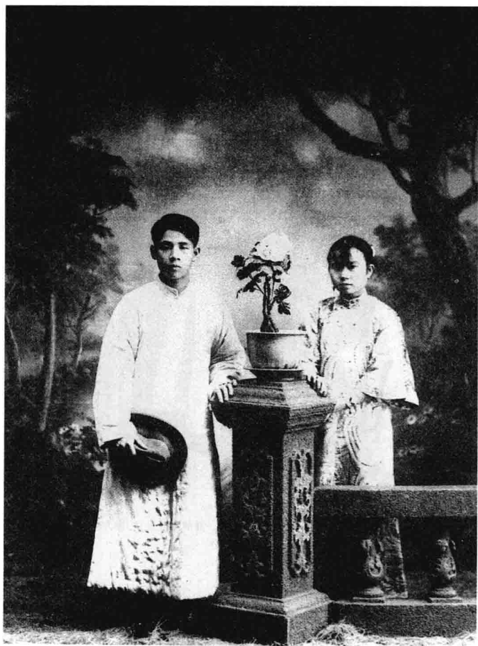
罗尔纲与陈婉芬新婚照（1927）