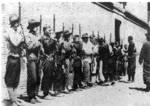
1927年上海工人第三次武装起义时的工人纠察队

一个特别能战斗的最革命的阶级,是现代中国革命的领导阶级。中国工人阶级的这种历史地位和作用,是任何别的阶级所无法取代的。1919年五四运动中,中国工人阶级开始以独立的姿态登上政治舞台,为了担负起领导革命的重任,迫切要求组成自己的政党。中国的先进分子促使马克思主义与中国工人运动相结合,在中国产生了工人阶级的政党——中国共产党。我们党从成立之日起,就把自己定为中国工人阶级的政党,始终坚