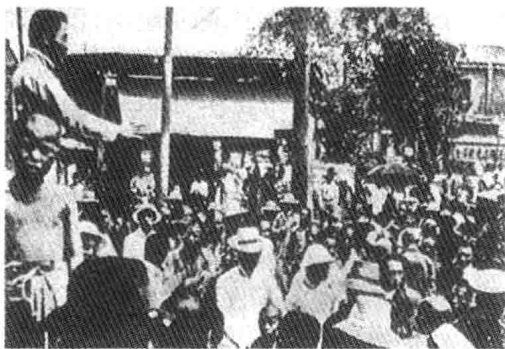
1919年,中国工人阶级首次大规模政治罢工

中国工人阶级产生于半殖民地半封建社会的特定历史条件和社会环境,除了具有无产阶级的一般优点外,还有其自身的特殊优点:第一,中国工人阶级深受帝国主义、封建主义、官僚资本主义的三重压迫,使得中国工人阶级更具有最坚决、最彻底的革命性。第二,中国工人阶级的分布比较集中,大部分集中在东南沿海和沿江城市,弥补了中国工人阶级绝对人数和占人口比例都很少的不足,便于组织和联系起来,形成强大的战斗力量。第三,中国工人阶级大部分来自破产农民,对农民有着深切的了解,同农民有一种天然的联系,便于同农民结成巩固的联盟。中国工人阶级的这些特点,决定了它是一个