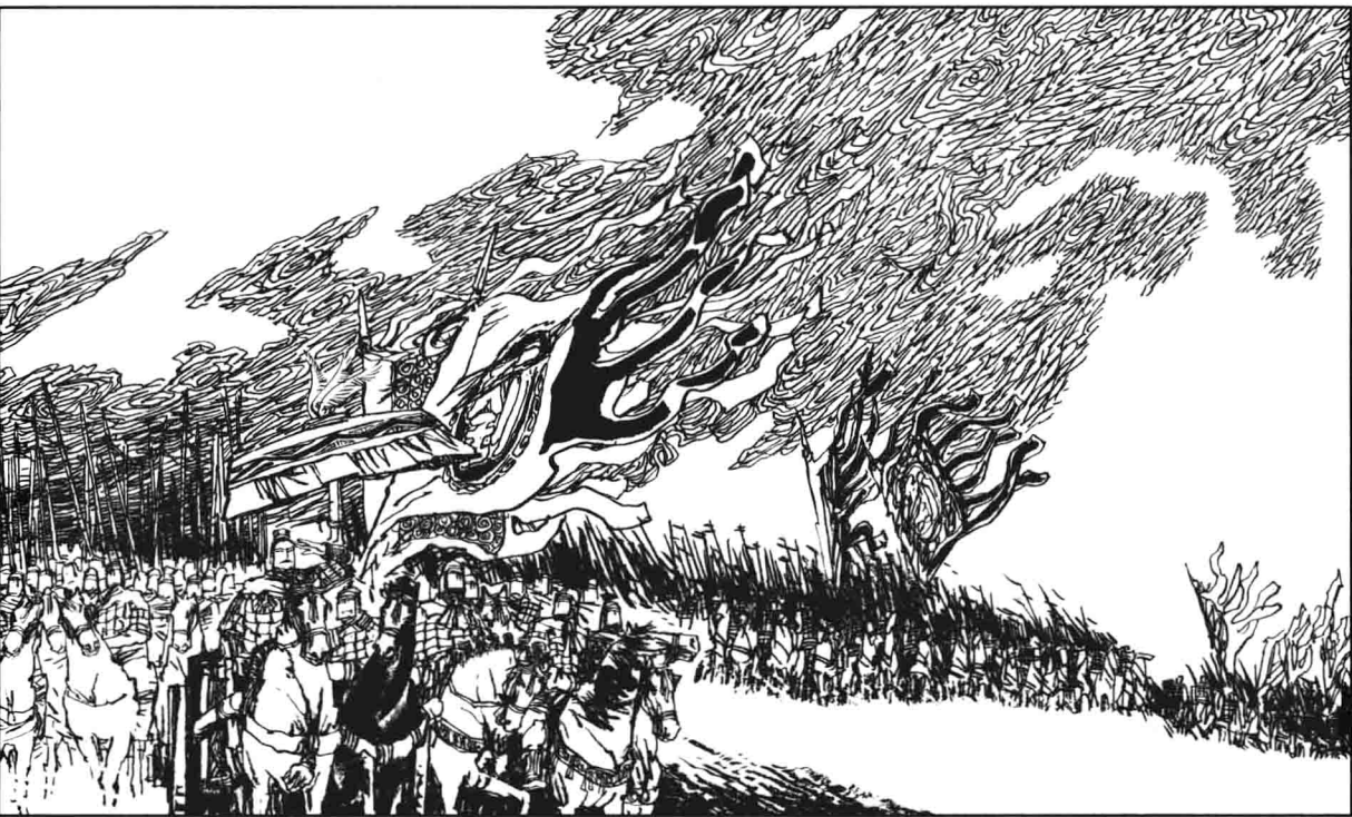
(9) 三路大军以逸待劳，赤眉军一到，就将他们团团围住。