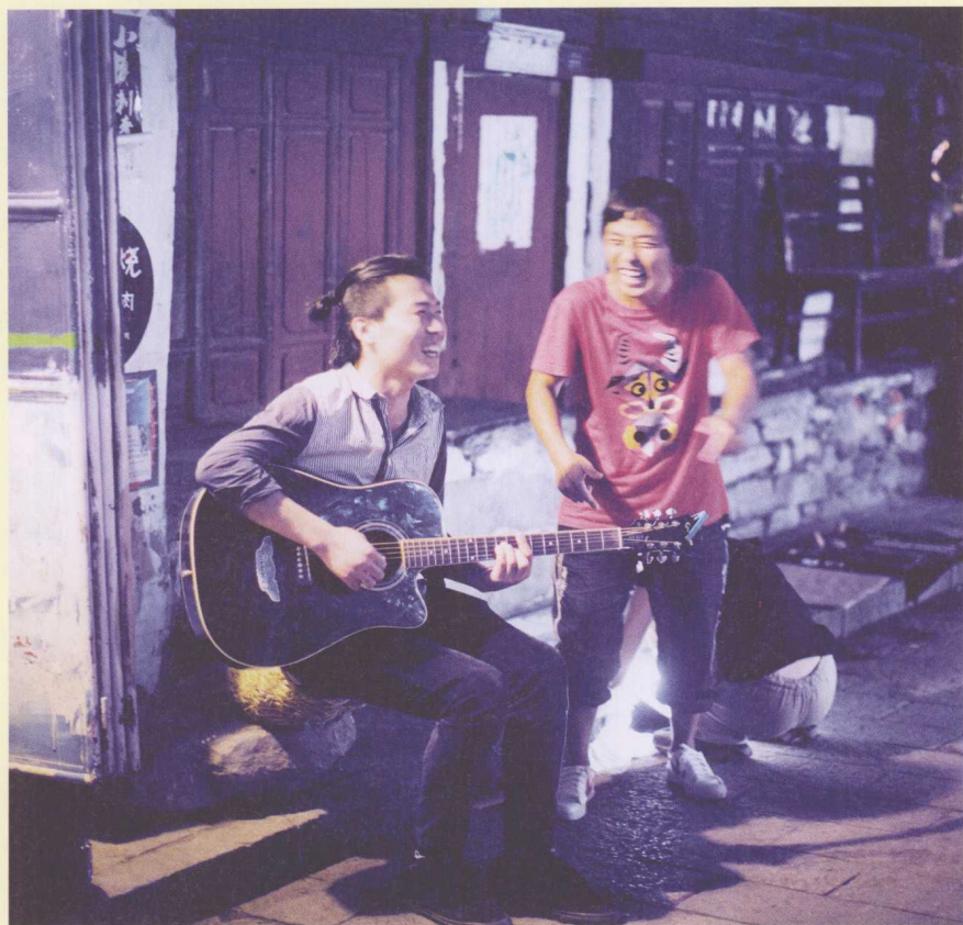
► 洋人街的深夜，街头歌手们还是唱得兴高采烈，附近的烧烤宵夜热浪喧天。