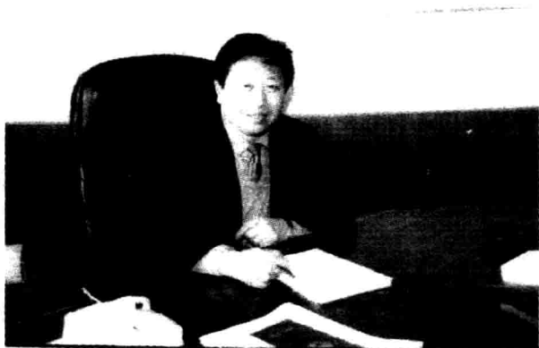
市长助理、开发区党工委书记于宏海近照