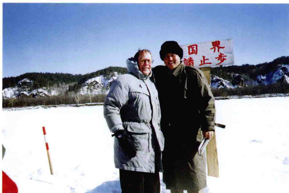
◆1997年，黑龙江漠河北极村。