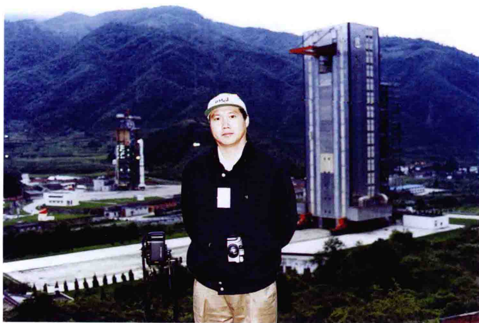
◆1997年，中国西昌卫星发射中心。