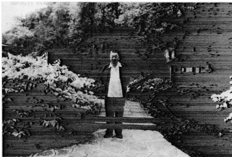
李今庸教授休闲照