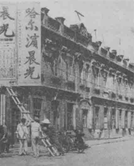
■ 1923年2月21日由我党创办的《哈尔滨晨光》报旧址(现道外十四道街街口)

争经验。1922年,在马骏的启发和指导下,韩迭声等人组织建立了有11个工人团体参与的“救国唤醒团”,以唤醒同胞反对帝国主义为宗旨,号召哈尔滨人民起来反对国际共管中东路,反对掠夺中国的不平等条约“二十一条”。从1921年到1924年,马骏还先后在宁安、吉林、绥芬河等地进行革命活动,传播马列主义。