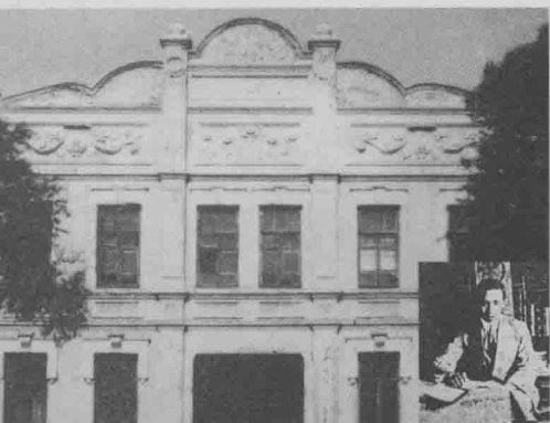
■ 1918年(现哈尔滨二中前身)是中共党员赴苏俄和传播马克思列宁主义集结地