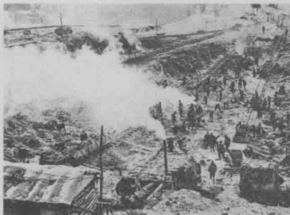
■ 20世纪初修建吉林丰满水库大坝工程的中国劳工

由于帝国主义的疯狂掠夺和封建军阀的残酷统治,使东北人民处于水深火热之中。富有反侵略斗争光荣传统的东北人民,不甘忍受帝国主义的野蛮蹂躏和封建军阀的残酷压迫,不断地掀起反帝反封建军阀的斗争。在这些斗争中,东北人民的思想觉悟不断提高,为以后马克思主义的传播做好