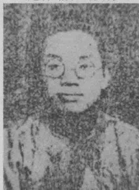
■ 1921年1月张太雷赴苏担任共产国际东方局中国科书记，在东华学校宣传革命思想

“四”运动后，一些具有初步共产主义思想的先进知识分子周恩来、马骏、瞿秋白等来东北时都利用演讲、讲课等形式向青年进行马列主义传播。