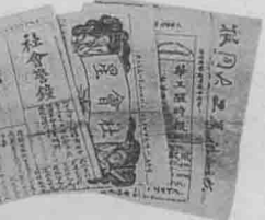
1920年前后旅俄华工回国时带回的大批宣传俄国十月革命的报刊