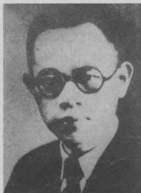
■ 1922年初罗章龙受中共北京区执委派遭到哈尔滨考察工人运动并建立党的组织