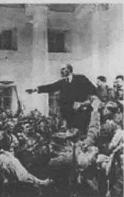
1917年11月7日，俄国爆发了伟大的“十月革命”