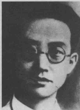
■ 瞿秋白1920年赴苏联考察途经哈尔滨，传播无产阶级革命思想