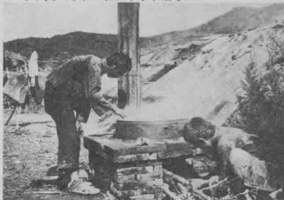
■ 20世纪初哈尔滨的劳工