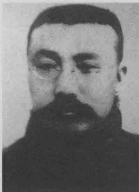
■ 1924年李大钊赴苏参加共产国际第五次大会途经哈尔滨