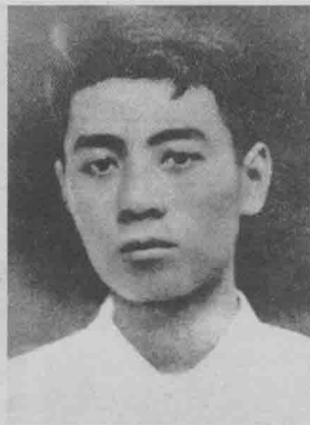
■ 1917年暑假，周恩来专程到哈尔滨看望邓洁民，对其筹办东华学校给予支持。1920年7月再次来哈看望邓洁民并在东华学校发表了“五四运动”情况的演讲