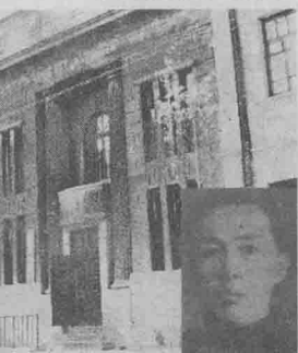
■ 1923年中共北京区执委派党员李震瀛来哈尔滨开展建党工作。1922年2月2日创办的哈尔滨救国唤醒团旧址(现道外区税务局)