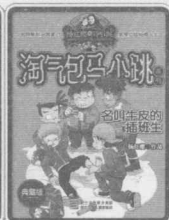
名叫牛皮的插班生