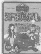
开甲壳虫车的女校长