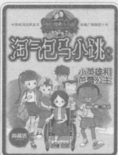
小英雄和芭蕾舞公主